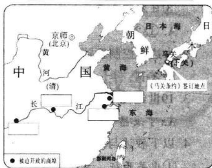
《马关条约》通商口岸示意图