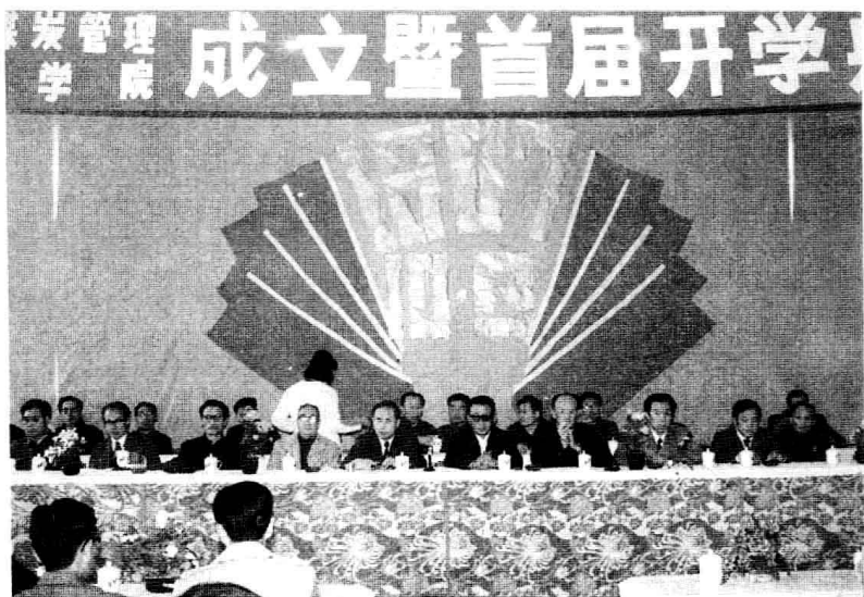
1987年10月8日,学院成立并举行首届开学典礼