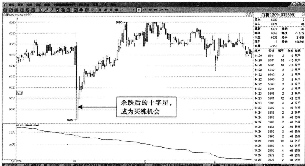
图 1-1 白糖 1209——5 分钟 K 线买涨十字星

后的价格走向，投机者会发现比较好的操作机会。白糖 1209——5 分钟 K 线买涨十字星如图 1-1 所示。