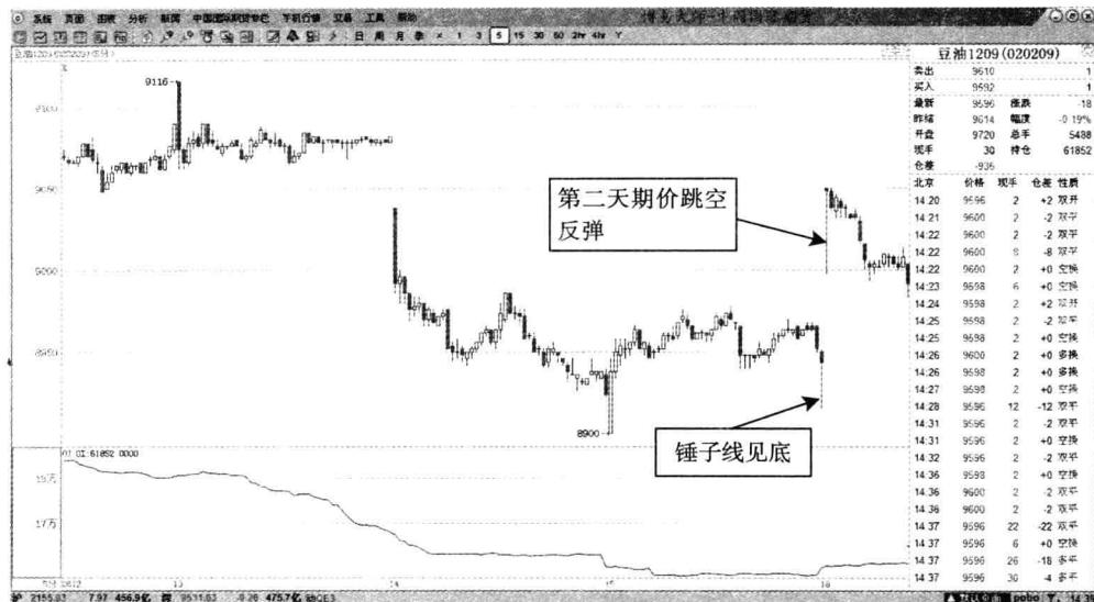
图 1-5 豆油 1209——5 分钟 K 线买涨锤子线

候，是价格由高位回落的信号。出现在期货价格顶部的类似锤子线的形态，被称为上吊线，表明期货价格即将反转回落，投机者可以趁机做空。豆油 1209——5 分钟 K 线买涨锤子线如图 1-5 所示。