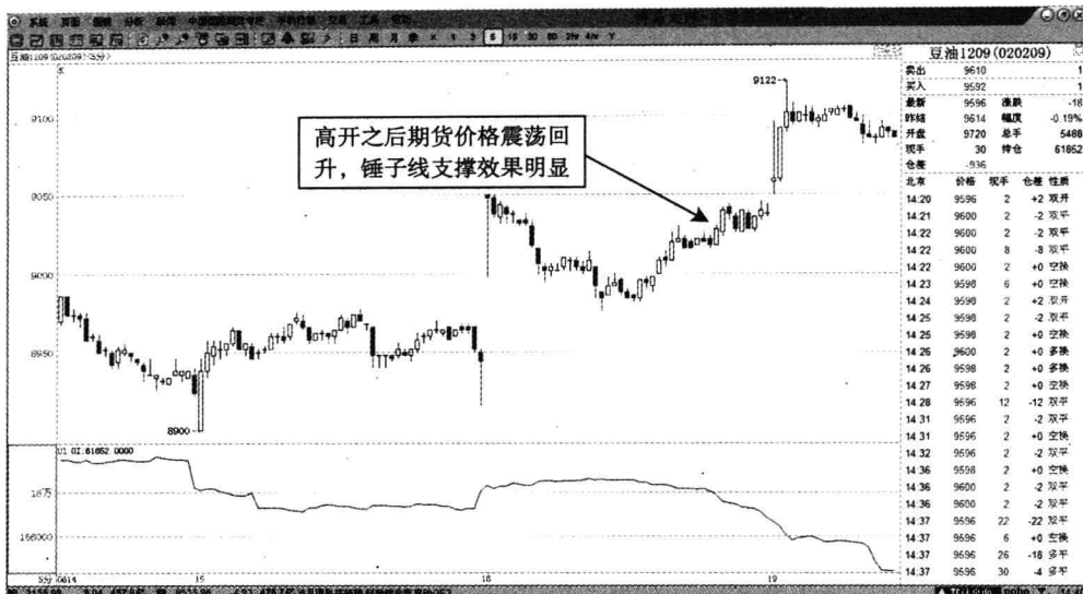
图 1-6 豆油 1209——高开之后震荡回升