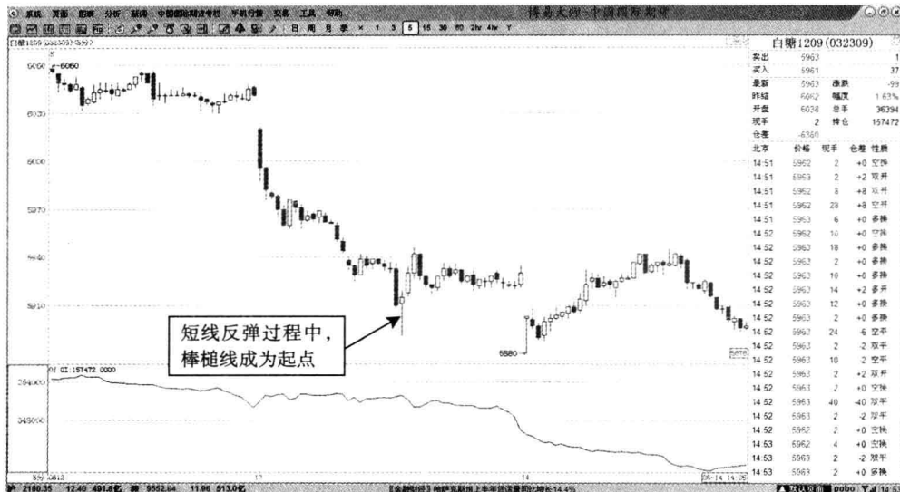
图 1-4 白糖 1209——5 分钟 K 线买涨棒槌线

该棒槌线已经是短线价格的顶部了。投机者在图中所示的位置开始做空，还是不错的选择。棒槌线之所以具备看跌的意义，与期货价格前后的运行趋势的反转密不可分。跳空上涨与持续回落的走势，明显是冲高回落的反转形态。投机者选择棒槌线后做空，显然是比较明智的做法。白糖 1209——5 分钟 K 线买涨棒槌线如图 1-4 所示。