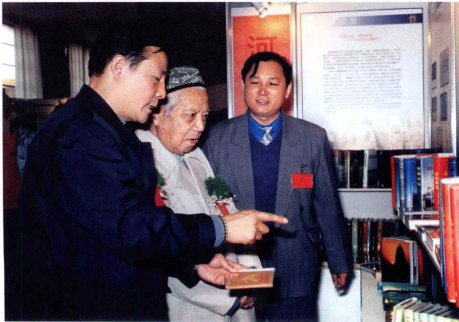
1999年北京全国新方志展览会上，作者（左）向原中共中央政治局委员邓力群（中）介绍河南修志成果