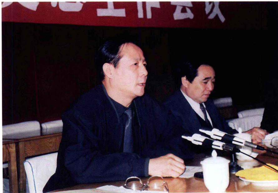
2002年3月，作者（左）在河南省地方史志工作会上作报告