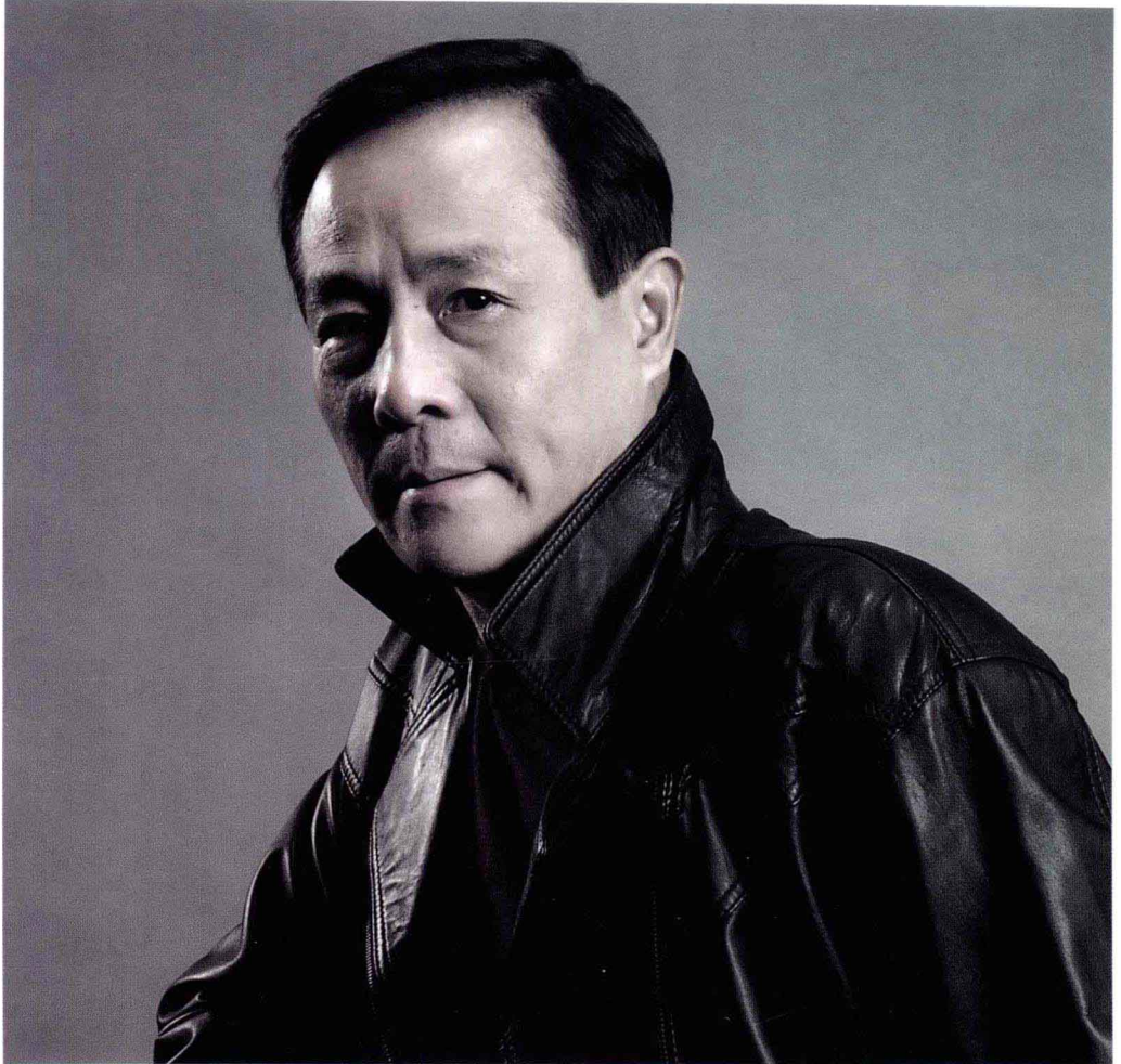
作者像 摄于2004年国庆