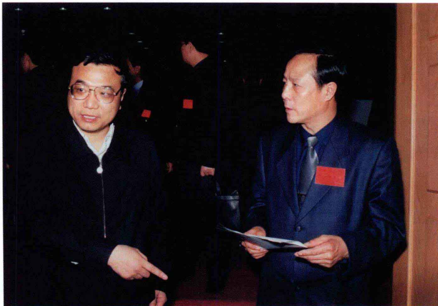
2001年4月，作者（右）在全省地方史志工作会上向河南省省长李克强（左）汇报工作