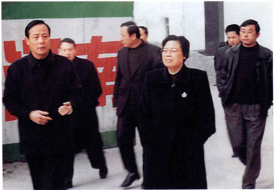
2003年春节前夕，河南省副省长王菊梅（右前一）视察省方志馆工程，作者（左一）在汇报工作