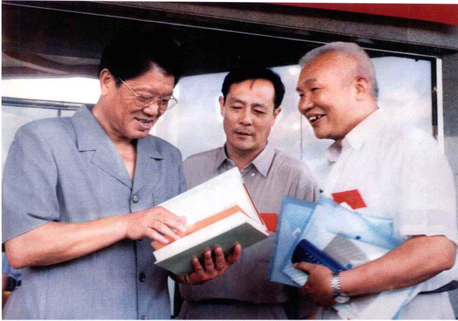
1997年全国新方志颁奖大会上，中共中央政治局委员、国务委员、中国地方志指导小组组长李铁映（左）翻阅《河南省志》，中间为作者