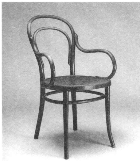
1. Model No.4椅 设计：米歇尔·汤勒特 1859年

们既买得起又造型美观让人愉快的陶瓷器皿，可以说，韦奇伍德是批量生产的先驱者。一些家具制造者也开始把新技术用到生产中，成功的例子是米歇尔·汤勒特（Michael Thonet, 1796 - 1871）。这位现代家具生产的先驱者，试图把现代工业生产的方法和手工艺的精细结合起来，大约在1830年左右开始采用