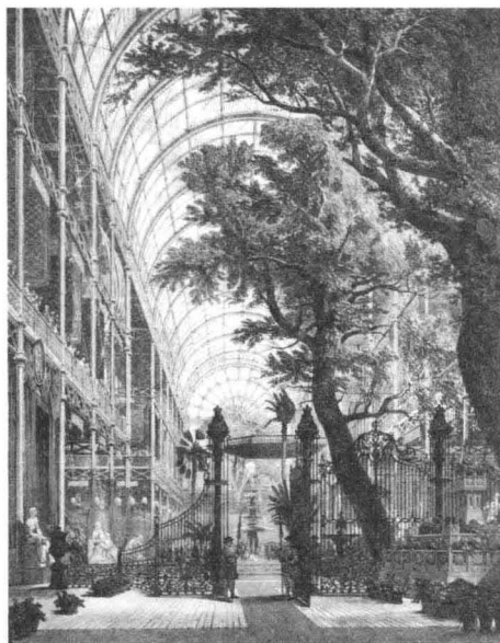
2.“水晶宫”内景 设计：约瑟夫·帕克斯顿 1854年

新技术生产曲木家具。他开发的生产技术是在蒸汽的压力下把坚硬的木材弯曲成圆形或S形，作为椅子的部件，由此制作出可以系列生产、结构简单、容易拆卸、适合搬运的家具。与那些笨重、昂贵的家具比较，汤勒特家具简洁轻便，便宜实用，造型优雅，是早期工业时代具有现代意义的家具。（图1）