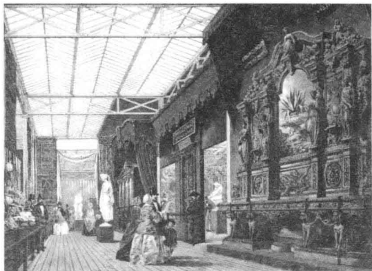
3. “水晶宫”里的工业建筑技术展区 1852年

博览会展出了15000件作品，主要是工业技术和发明的成果。这些作品表现出过分的装饰和对历史风格的参考，被一些人认为是造型的大杂烩和各种历史风格的东拼西凑。因为当时还没有专门的人从事适合工业化生产的设计工作，许多机器生产的日用品的设计工作都是由工程师完成的。工程师们没有受过专门的美学和艺术的教育，他们设计的大多数产品在风格上模仿维多利亚时代繁琐的造型和装饰，看上去庸俗不堪，毫无美感可言。加之当时的机器生产水平低下，大量的产品在造型上非常粗陋。对于这些展品在美学品质方面的低劣程度，许多具有社会责任感的评论家和知识分子都深感不安。他们认为，一个国家的道德和伦理状态可以从他们的艺术和生活用品中反映出来，产品美学品质的降低是国家道德水平降低的表现。如果人们使用这些日用品，不仅会降低他们的生活品质，同时还会导致整个社会道德水平的下降。（图3）