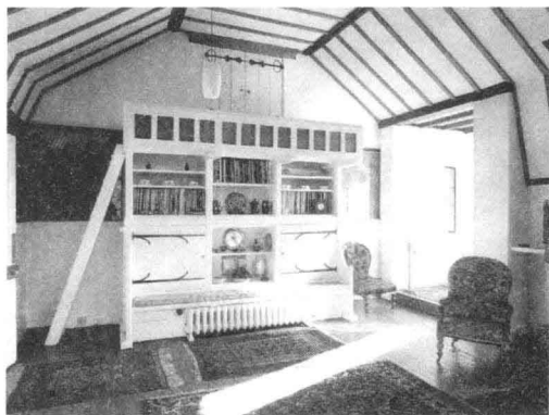
6. “红屋”室内 1859年

的结合体,一些细部还使用了哥特式风格的建筑元素。这一建筑是由内而外设计的,普通的外立面墙掩盖了室内的设计,建筑的外观只是被当做次要部分来考虑。出于对当时市面上品位低俗的日用品的反感,室内的装修布置都是莫里斯本人和他的朋友一起设计的,他们为这一建筑设计制作了精美的家具、壁纸和地毯等,威廉·莫里斯革新实用艺术的理想也由此开始。(图6)