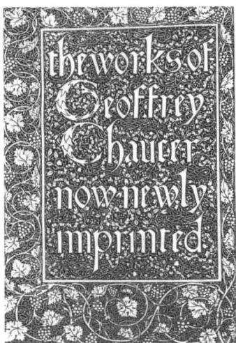
9a. 莫里斯公司出版的《乔叟作品集》，莫里斯设计装饰和字体，伯恩-琼斯插图

威廉·莫里斯是设计师、作家和诗人，他还是一个社会活动家，一个具有民主思想的理想主义者。他看到了工业化的负面影响——环境污染、失业，以及质量低劣的批量产品，他激烈地反对工业化生产。对他来说，美和社会问题是分