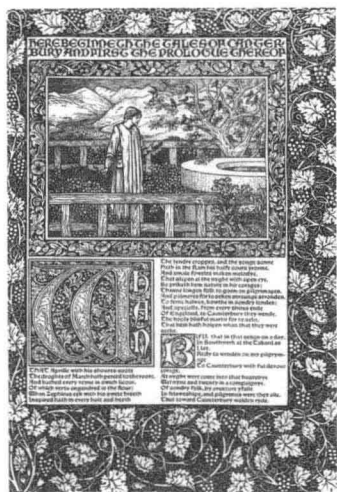
9b. 莫里斯公司出版的《呼啸平野的故事》，沃尔特·克莱恩插图，1894年

不开的，他声称要通过对实用艺术的革新来解决这些问题。莫里斯认为手工艺品应该具有很高的美学品质，反对繁琐的历史主义的装饰，他欣赏自然的装饰和材料，以及简洁清晰的结构造型。他发起的工艺美术运动试图把艺术的美与手工艺技术结合起来，使手工艺品具有艺术的审美品质。莫里斯的艺术与技术相结合的思想后来发展成为现代设计最重要的思想，只是工业技术代替了莫里斯倡导的手工艺技术。同时，在莫里斯的思想里，具有浓厚的民主思想成分，也就是为大众设计的思想。但他高品质的设计和精致的手工制作形成的产品价格，并不能为平民所接受，他的贵族出身和高雅风格也影响了他为大众服务理想的实现，他作坊式的手工制作方式因为与工业化大生产的时代发展潮流不符而未能发扬光大。威廉·莫里斯所推崇的是复兴手工艺，反对大工业生产，虽然他在后来也看到了机器生产的发展趋势，在他后期的演说中承认我们应该尝试成为“机器的主人”，