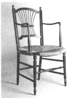
8. 莫里斯公司生产的 Rossetti 椅子 设计: 罗塞蒂(Dante Gabriel Rossetti) 1864-1865 年

拉斐尔前派,由罗塞蒂和他的几个朋友创办,成员包括了工艺美术运动的发起者威廉·莫里斯,是一些试图革新英国艺术的艺术家的组织。他们偏爱中世纪风格,理想的绘画形式是意大利 15 世纪的绘画,即拉斐尔之前时代的绘画,也是没有经过美化处理的自然创作。拉斐尔前派极大地推动了英国工艺美术运动,并影响了后来的新艺术运动。