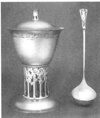
12. 银碗 设计：查尔斯·罗伯特·阿什比 1902—1903年

想忠实的追随者和实践者，他在设计中寻求一种有机的整体感和纯粹的抽象形式，他线条流畅、造型优雅的银器制品是工艺美术运动风格的代表作（图12）。“手工艺行会”的作品主要是珠宝、金属器皿和家具。他们没有刻意把作品制作得很精致，打磨得光滑明亮，而是在作品中展现出加工制作的程序和方法，金属器皿甚至可以看出锤子敲打的痕迹。为了使他们的产品能够为大多数人所接受，很多珠宝和银器都采用比较便宜的石头和彩色搪瓷进行装饰。阿什比早先并不认同机器生产，认为那是为了获得利益而牺牲人性的特征，但他后来发现，谨慎地使用机器可以带来便利。尽管如此，阿什比仍然把工艺美术运动的理想作为个人的信仰。