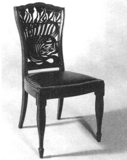
11. 椅子 设计：马克穆多 1882-1883年

把它用做“改善我们生活条件的一项工具”，但他一生致力工艺美术运动却是反对工业文明的。（图10，附录4）