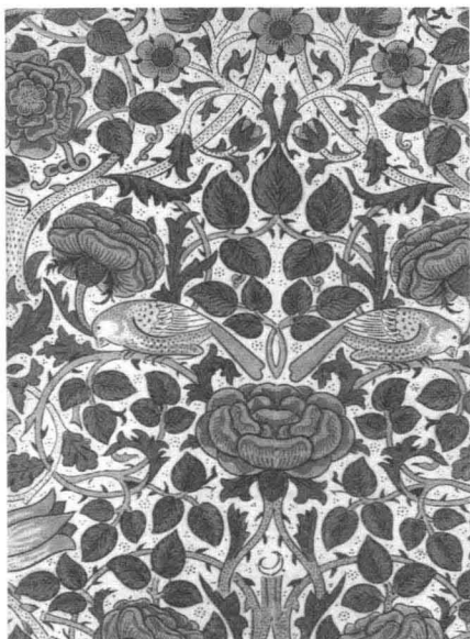
10. “鸟与玫瑰”纺织品图案 设计：威廉·莫里斯