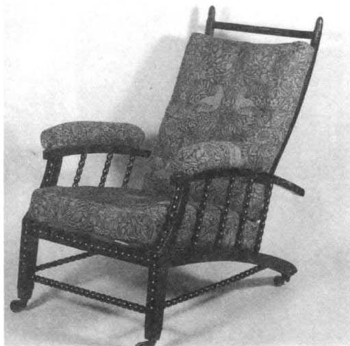
16. 椅子 设计: 威廉·莫里斯