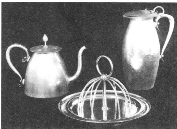
14. 铜茶具 设计：查尔斯·沃赛 1896 - 1900年

管仍然属于古典风格的范畴，其质朴、清新的特点成为古典风格向现代风格发展的过渡风格。工艺美术运动形成的风格与艺术家们的思想是密不可分的，工艺美术运动就是要用高品质、高美学的实用艺术来对抗当时品质低劣的工业化产品，以实现他们所追求的信念“一个