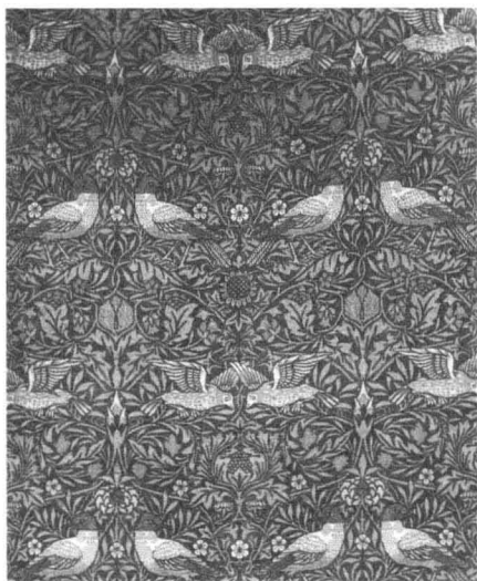
15. 花鸟纹纺织品图案 设计: 威廉·莫里斯 1878年