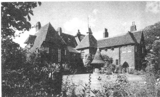
5. “红屋” 设计: 菲里普·韦伯 1859年

1859年, 受莫里斯委托, 建筑师菲里普·韦伯 (Philip Webb, 1831 - 1915) 为莫里斯在肯特 (Kent) 设计了一幢住宅, 这是一栋具有创造性的建筑, 强调了功能性、实用性和舒适性。因外墙用了红砖, 他们为之取名为“红屋” (图 5)。“红屋”打破了对过去建筑缺少创造性的模仿, 是哥特式建筑与英国乡村建筑