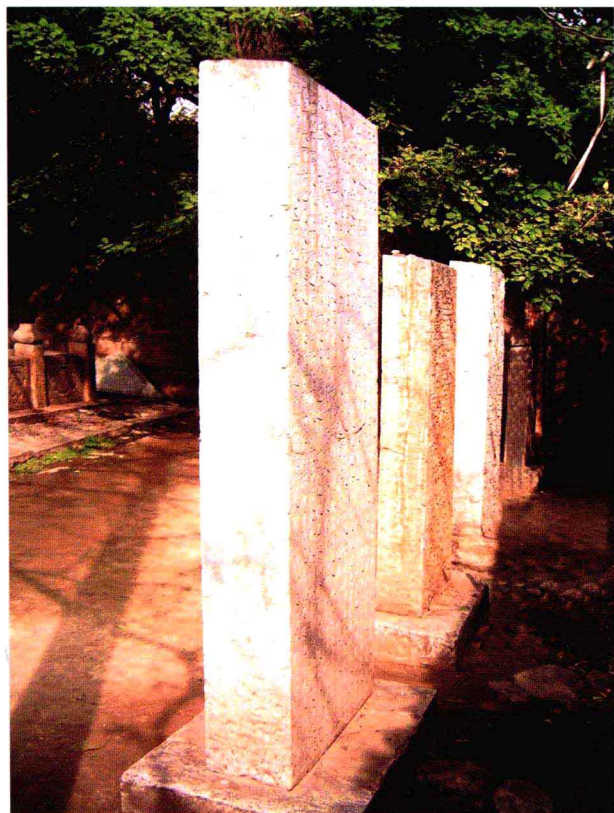
泰山凿泉记碑，碑阴有文