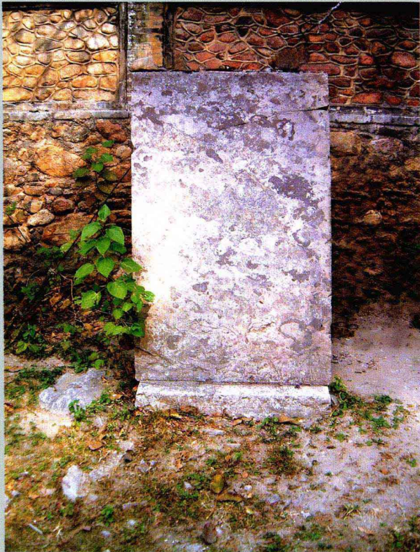
首行“所谓王母也哉”碑