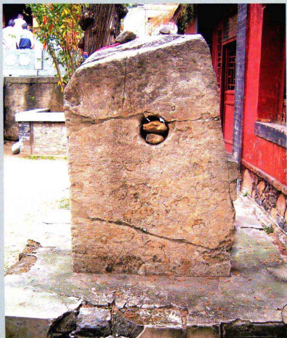
残碑：安隆王母池题刻

此题刻在王母池院内观澜亭门外南侧，刻于宋政和八年(1118)。石高100厘米，宽69厘米，中上部有圆孔，直径12厘米。题名7行，满行9字，字径4厘米，楷书。又有万历六年(1578)及崇宁年残刻，已漫漶。