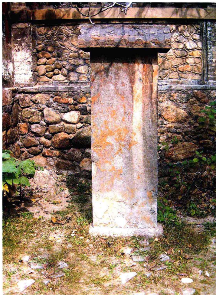
开山会记碑。大清乾隆二十九年(1764)十一月二十五日立

此碑在王母池山门外东侧，立于乾隆二十九年(1764)。碑高166厘米，宽60厘米。碑阳文7行，字径1.5厘米，楷书。铭文已残不可读。