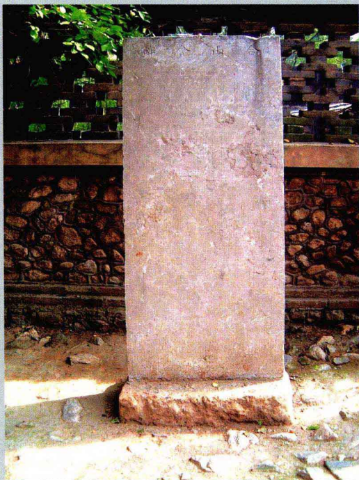
石碑等村善信题名碑