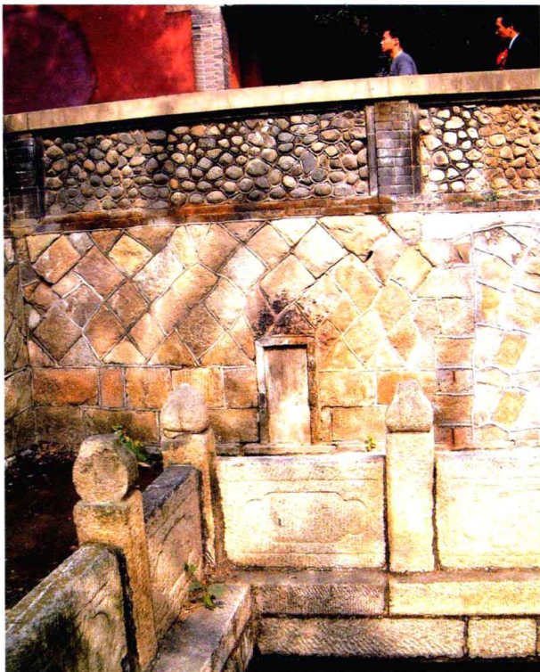
三题刻环境，其中两题刻已垒到水池墙里面，其一为《李若清等题名碑》；其二为宋元祐八年《重修王母殿碑记》