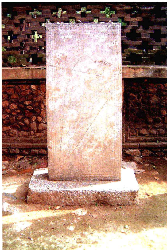
额：合山会碑，邱家店等村信女题名碑。大清道光十年(1830)岁次庚寅菊月上浣谷旦