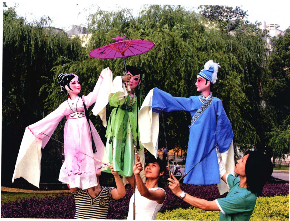
湖南省木偶皮影艺术剧院杖头木偶（外杆）