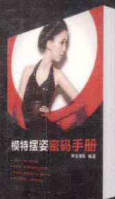
模特摆姿密码手册