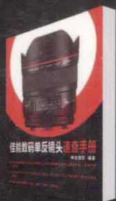
佳能数码单反镜头速查手册