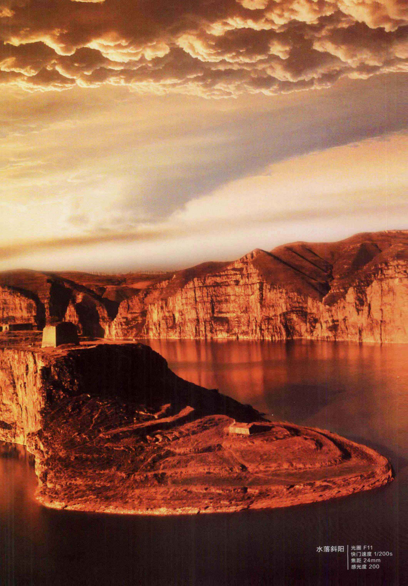
水落斜阳 | 光圈 F11 快门速度 1/200s 焦距 24mm 感光度 200