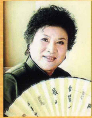
劉蘭芳 著名評書表演藝術家