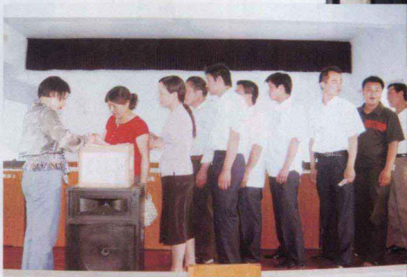
民权县国土资源局党员积极缴纳“特殊党费”支援灾区救灾