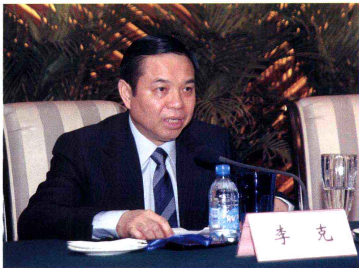
省委常委、常务副省长李克讲话

3月1日~2日，全省国土资源工作会议在郑州召开。会议强调，要以科学发展观为统领，进一步强化国土资源工作，推动我省经济社会又好又快发展。省委常委、常务副省长李克，副省长张大卫出席会议并讲话。会议由省政府副秘书长张庆义主持。