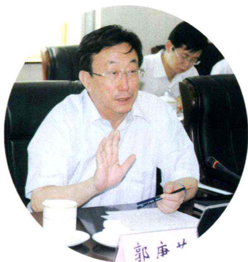
河南省委副书记、代省长郭庚茂