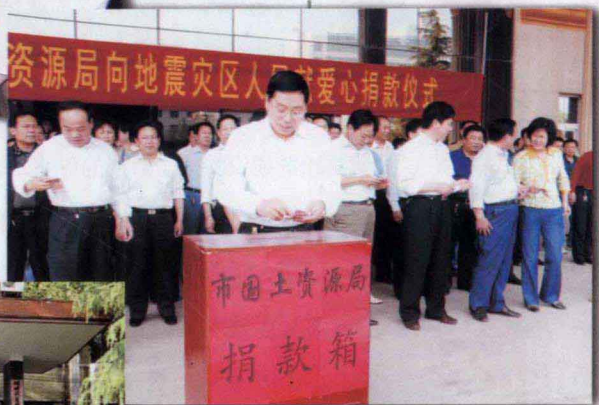
商丘市国土资源局系统干部职工积极为灾区捐款