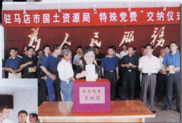
驻马店市国土资源局党员干部积极缴纳“特殊党费”