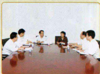
执法监察总队传达学习有关精神