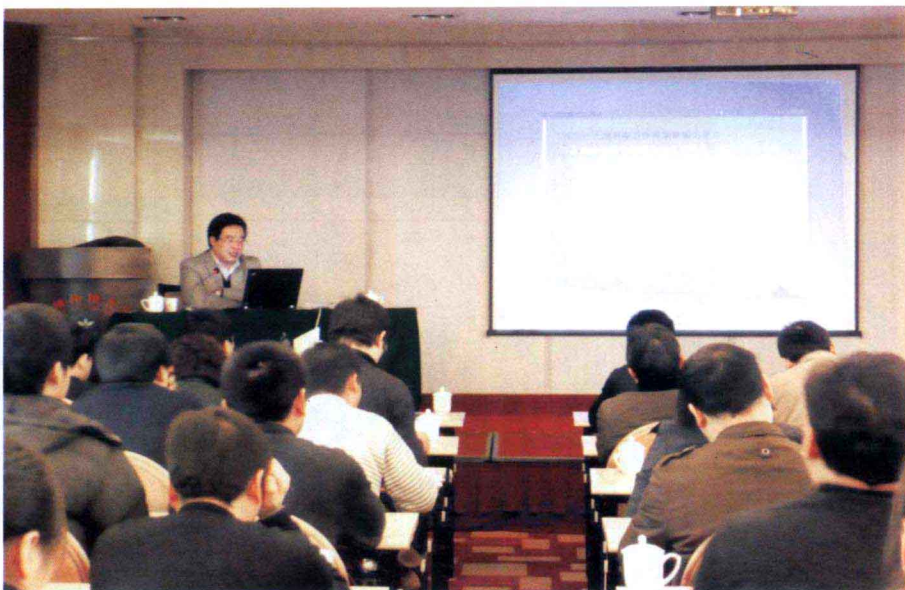
规划修编专家讲课

我省《土地利用总体规划纲要》首批通过国土资源部审查，并已上报国务院审批。规划期内国家给我省的建设占用农用地指标23.4万公顷，建设占用耕地指标18.33万公顷，建设用地增量24.78万公顷，共核减我省基本农田14.14万公顷，占全国核减面积的10.6%，取得历史性突破。我省上报的重