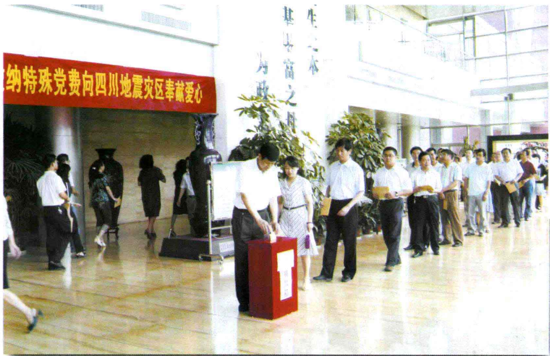
省厅党员踊跃缴纳“特殊党费”

5月12日，四川省汶川地区发生8.0级特大地震。震区人民的安危牵动着全国人民的心，也牵动了河南省国土资源系统广大干部职工的心。一方有难，八方支援，面对这场前所未有的灾难，河南国土人纷纷伸出援助之手，用爱心谱写了一曲抗震救灾的壮丽乐章。