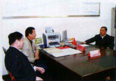
郭公民副厅长在洛阳调研