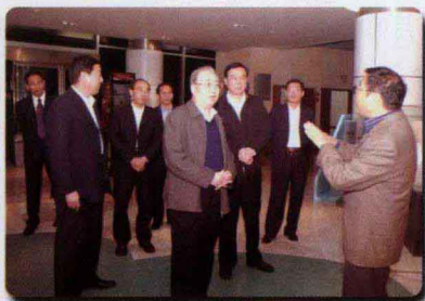
中央指导检查组参观省地质博物馆

从11月3日开始，由厅领导带队组成的5个调研组，已全部深入基层开展“大调研、大接访”活动。为确保活动取得实效，省厅学习实践活动领导小组进行了认真筹划和周密部署。