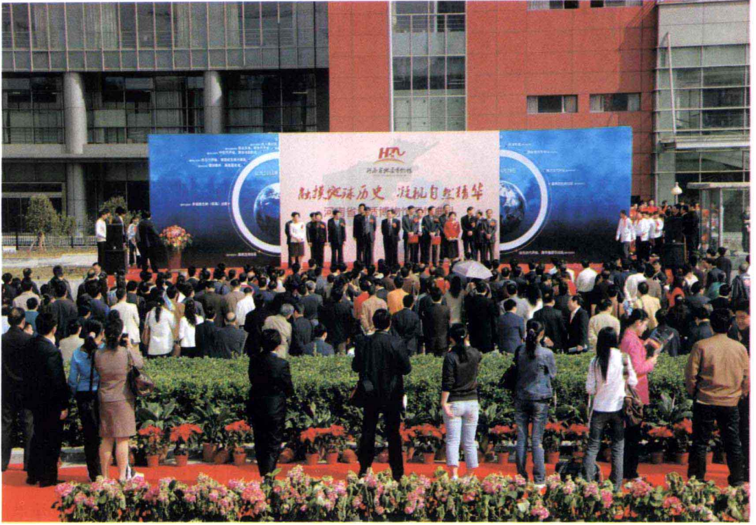
河南省副省长张大卫（右）与国土资源部科技司司长彭齐鸣为地质博物馆揭牌