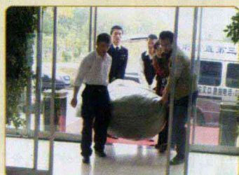
落实行动，积极为灾区捐过冬物资