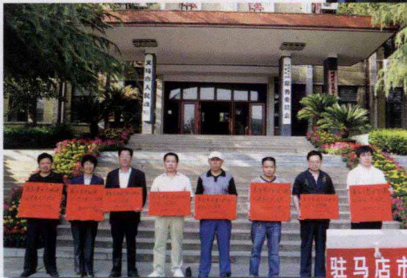
义马市矿山企业向地震灾区捐款17.5万元人民币