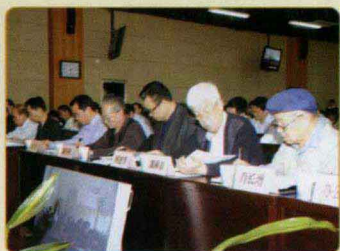
老干部参加厅动员大会