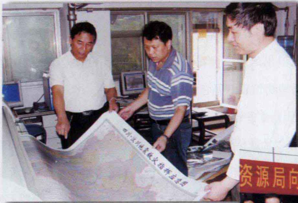
河南省测绘局积极为抗震救灾提供专题测绘保障服务