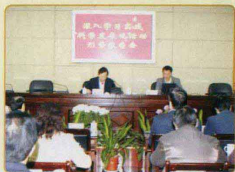
中国地质科学院全球矿产资源战略研究中心主任王安建教授作专题报告