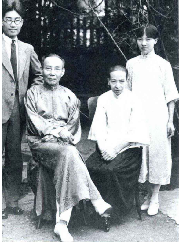
冰心、吴文藻夫妇与冰心父母

1929年夏，新婚不久的冰心、吴文藻夫妇回上海省亲，与冰心父母共享天伦之乐。遗憾的是，冰心母亲不久逝世。新婚燕尔遭此不幸，可谓是乐极处忽生悲劫。