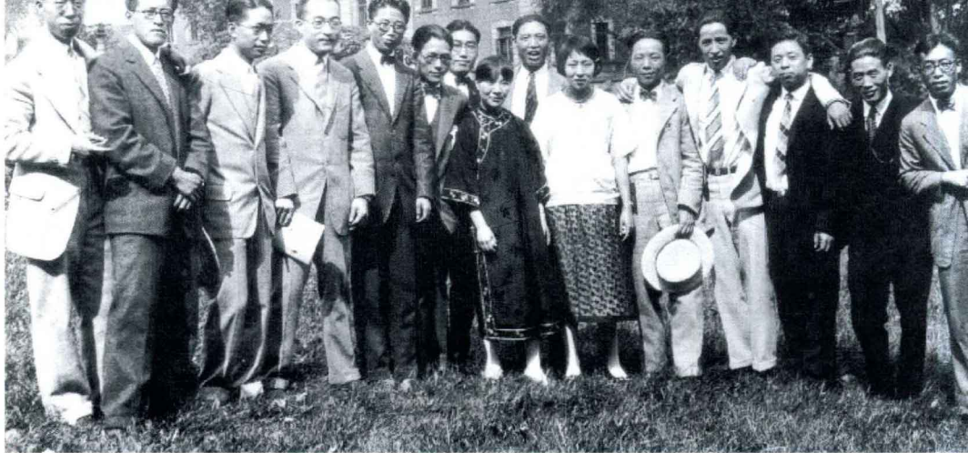
1925年9月，中国留美学生举行年会的合影

合影中的左七、左八正是恋爱中的吴文藻与冰心。爱情真是个奇妙的东西，在你毫无准备的时候，它却固执的在你的心中悄悄生根发芽。冥冥之中注定，冰心和吴文藻在这海阔天空里相会了，彼此的生命都悄然打开了另一扇窗户。