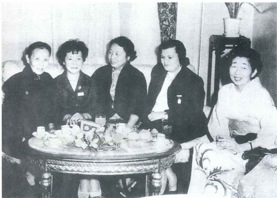
1962年，冰心（左一）与日本女作家合影

周总理的才华和风度给冰心留下了深刻的印象，她回忆说：“周恩来总理是十亿中国人民心目中的第一位完人。”