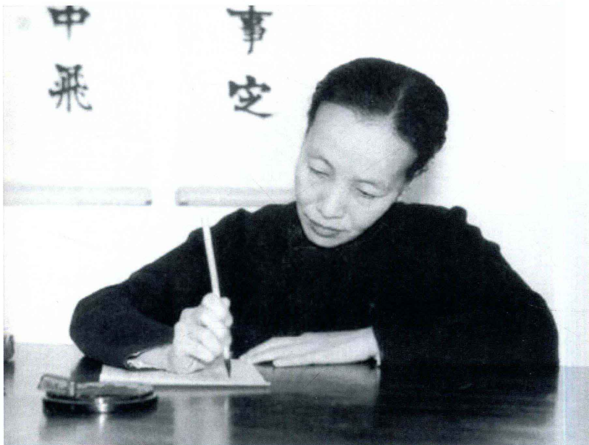
冰心在日本东京写作

1949年，冰心被东京大学聘为教授，讲授中国近代文学，成为有史以来的第一位女教授。