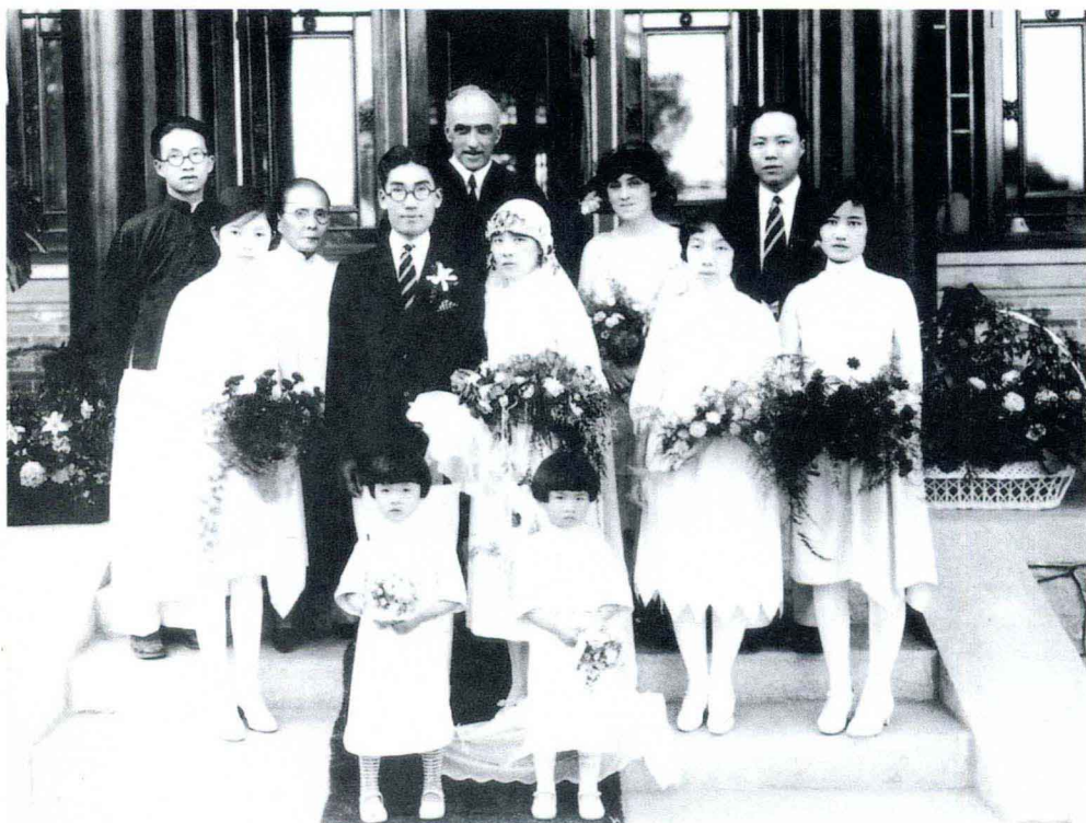
1929年6月15日下午4时，冰心和吴文藻在燕京大学临湖轩举行婚礼时的合影

1929年夏，新婚不久的冰心、吴文藻夫妇回上海省亲，与冰心父母共享天伦之乐。遗憾的是，冰心母亲不久逝世。新婚燕尔遭此不幸，可谓是乐极处忽生悲劫。