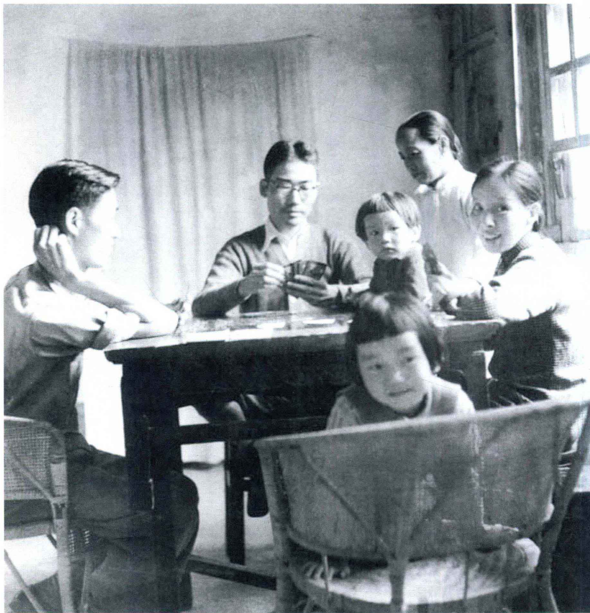
1939年，冰心一家在呈贡的“默庐”临时住所

直至晚年，冰心对于这一段居住时光仍是念念不忘，“回溯平生郊外的住宅，无论是长短居住，恐怕是默庐最惬意……论山之青翠，湖之涟漪，风物之醇永亲切，没有一处赶得上默庐”。