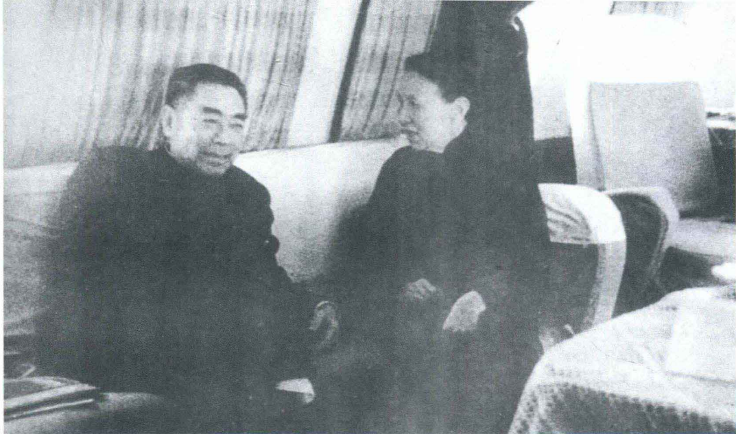
1962年周恩来总理与冰心在飞机上闲话家常

周总理的才华和风度给冰心留下了深刻的印象，她回忆说：“周恩来总理是十亿中国人民心目中的第一位完人。”