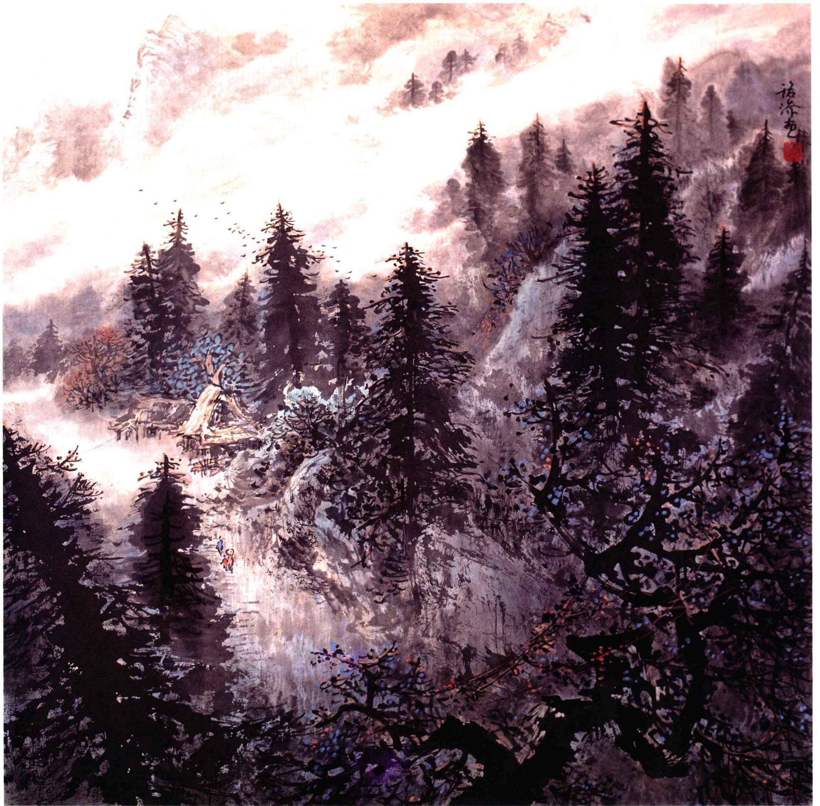
峨眉清翠 68cm×68cm 纸本设色 1998年