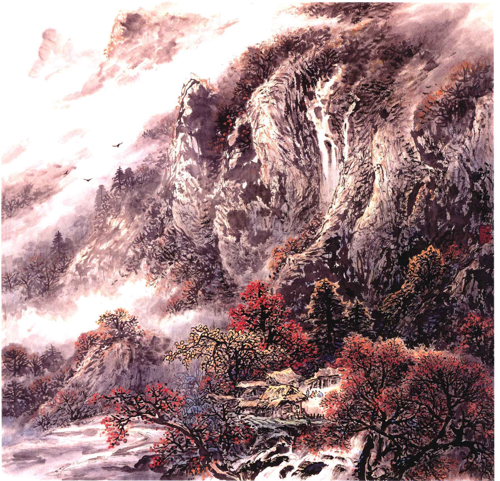
山居秋色 68cm×68cm 纸本设色 1998年