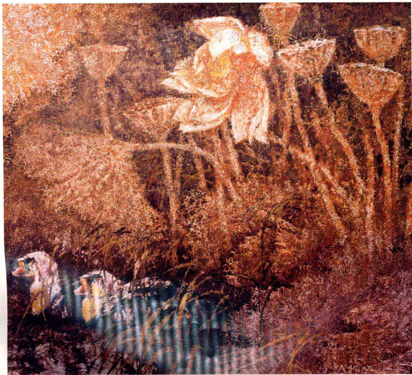
下: 荷荡倩影 (1997年)