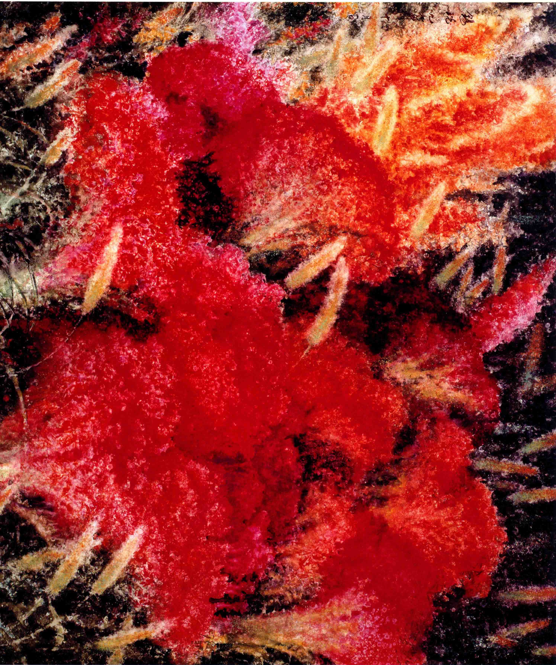
万紫千红 (1997年) 71cm x 78cm