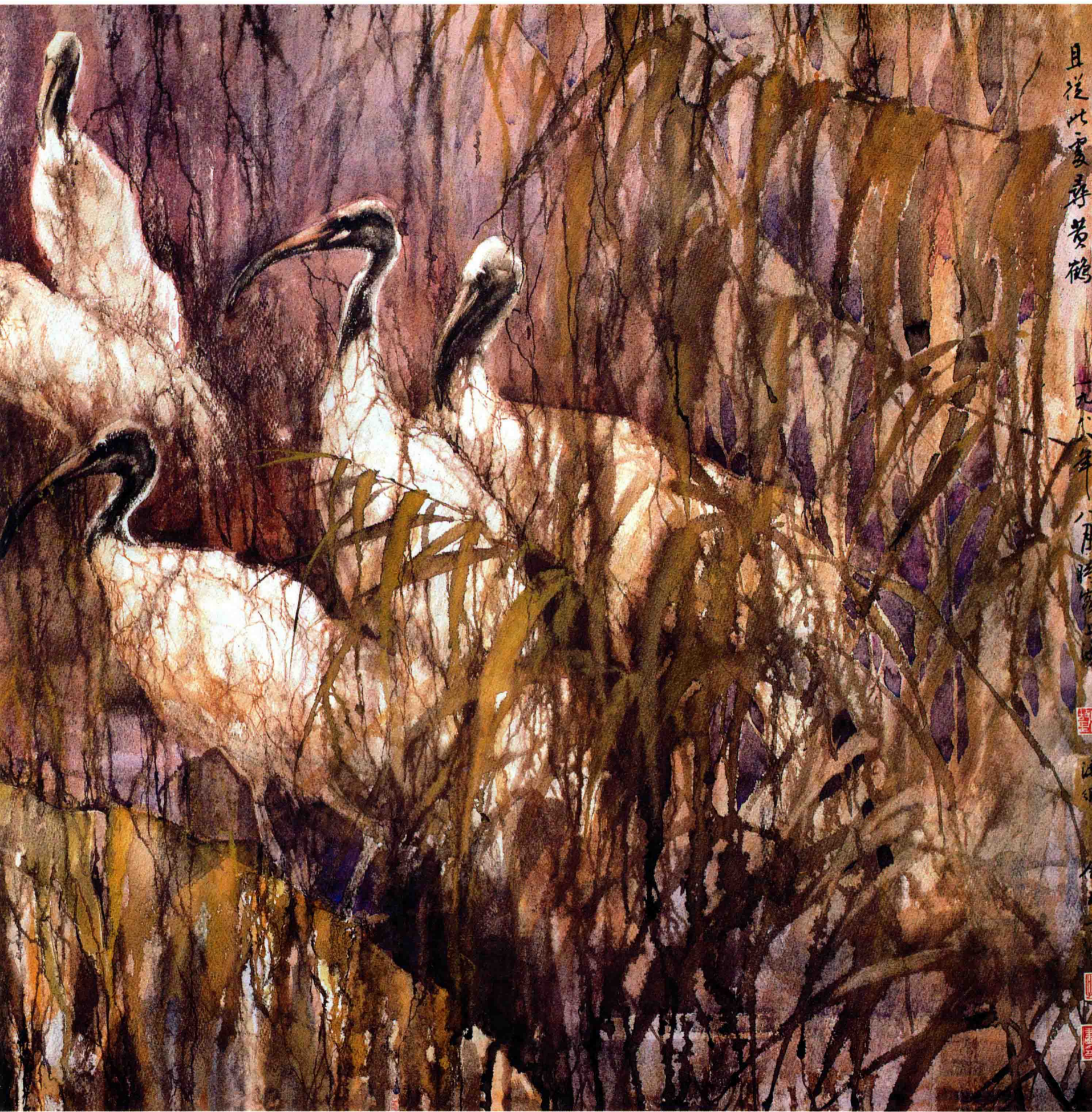
黄鹤仙踪 (1988年) 76cm × 152cm