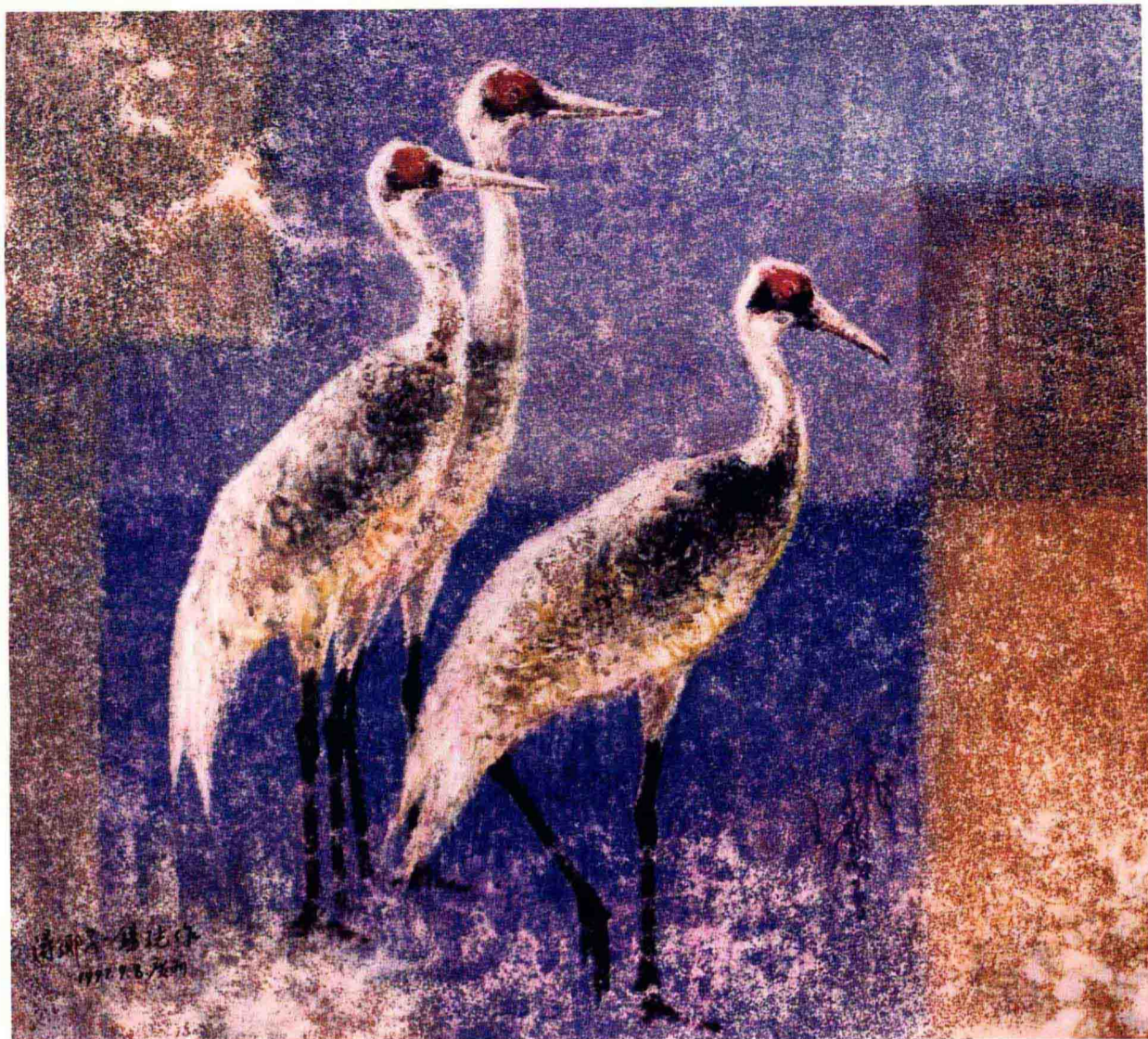
上: 寄望 (1997年) 71cm × 78.5cm