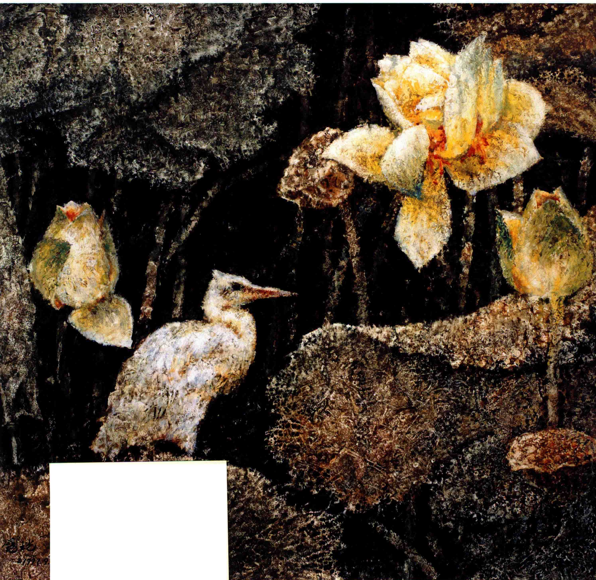
荷鹭 (1997年) 71cm × 78.5cm