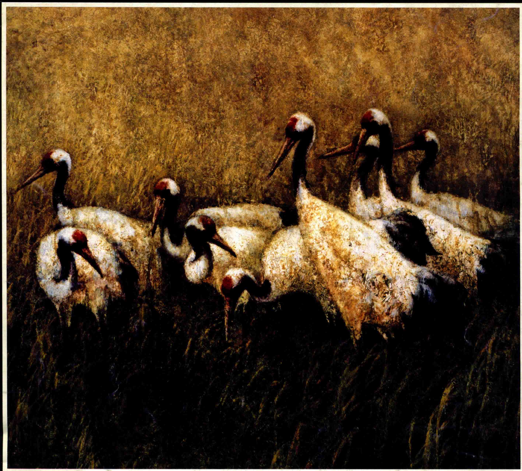
鹤寿图 (1997年) 71cm × 78.5cm