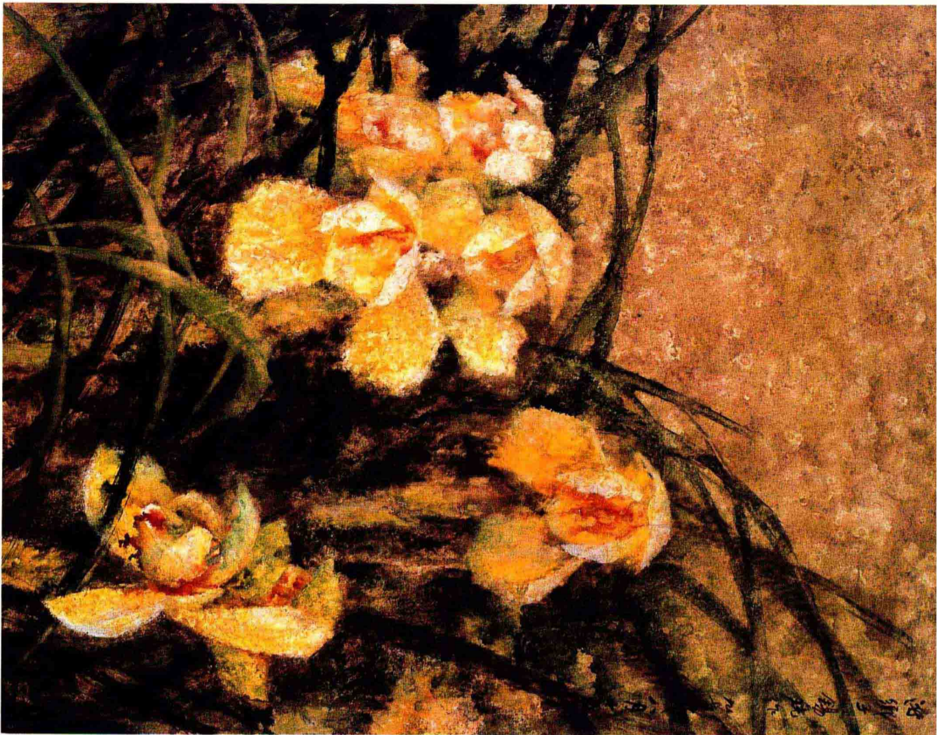
丽骨芳心 (1997年) 61cm X 79cm