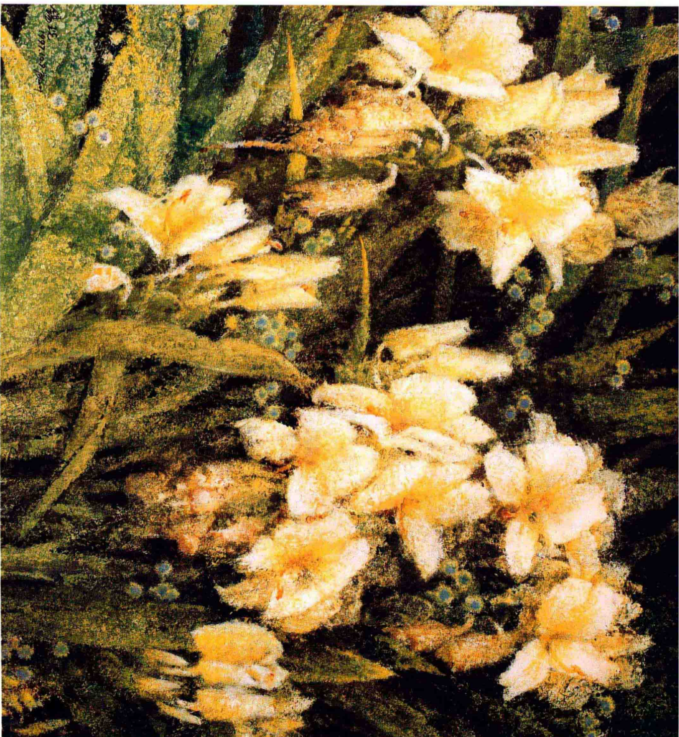
容淡香远 (1997年) 71cm X 78.5cm