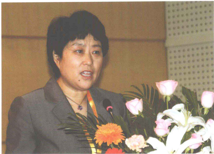
中国人民大学副校长冯惠玲出席“老子思想与构建和谐”国际论坛并致辞