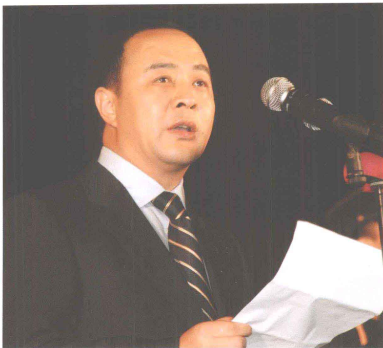
中共周口市委书记毛超峰在 2008·中国鹿邑国际老子文化节开幕式上致欢迎词