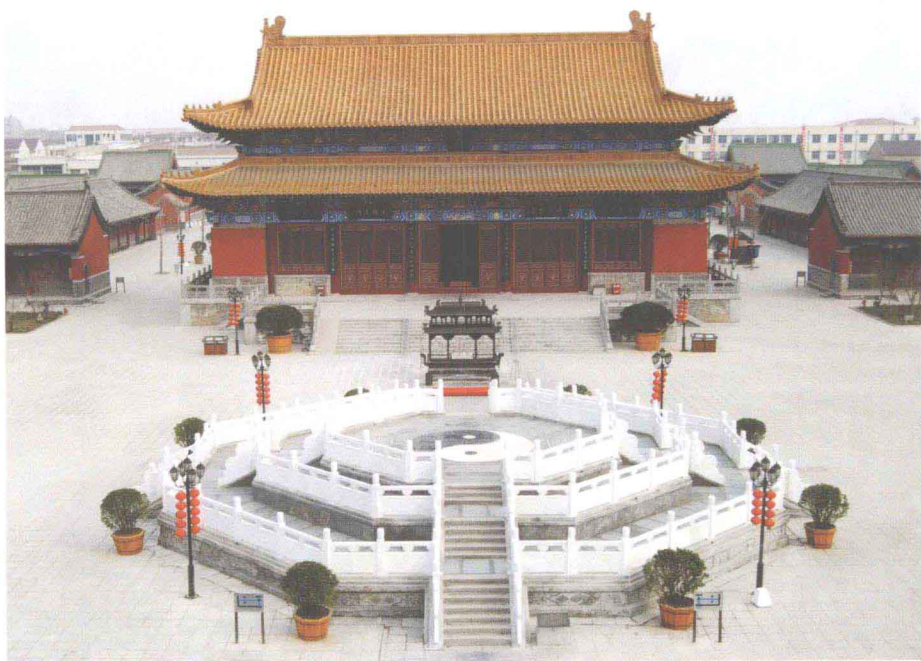
老子讲学地——明道宫