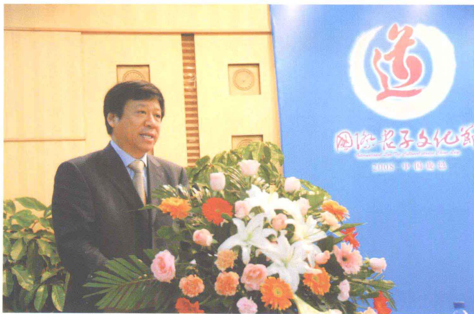
河南省政协副主席靳绥东在“老子思想与构建和谐”国际论坛开幕式上讲话