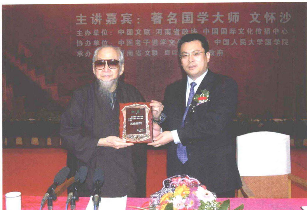
老子文化节期间,鹿邑县人民政府县长刘政代表鹿邑县人民政府向著名国学大师文怀沙先生颁发“老子故里老子文化高级顾问”聘书