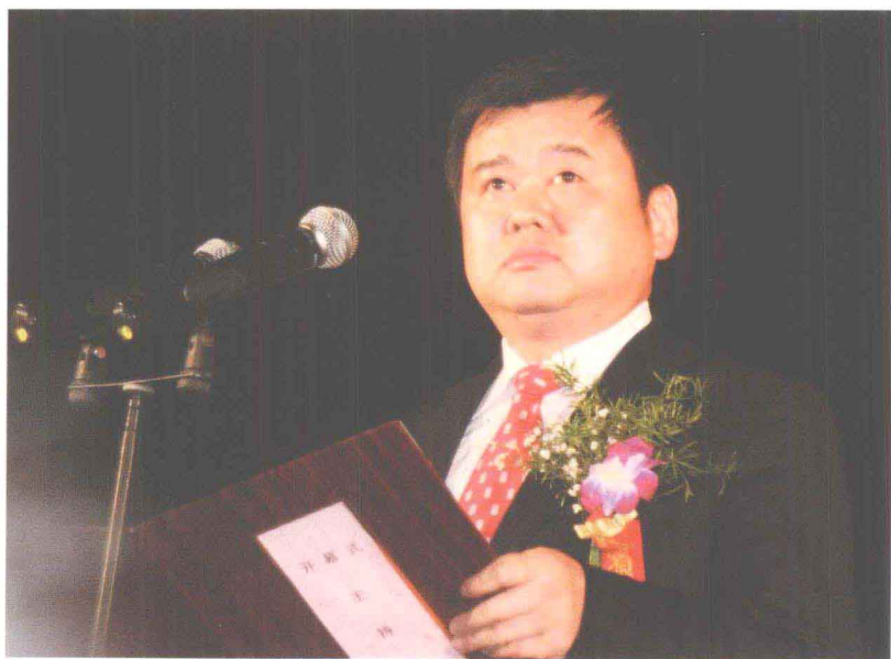
周口市人民政府市长徐光主持 2008·中国鹿邑国际老子文化节开幕式