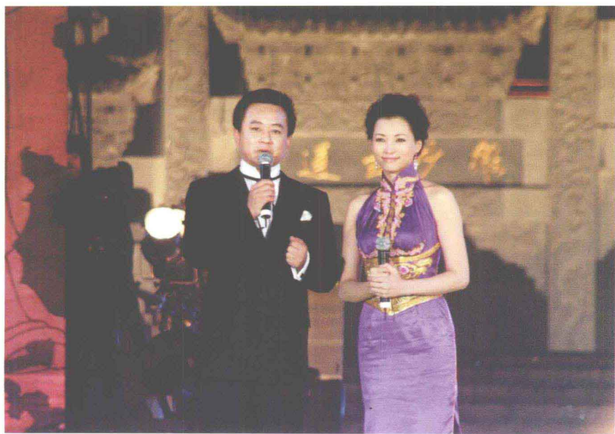
中央电视台著名节目主持人朱军、 董卿主持2008·中国鹿邑国际老子文化 节『天地人和』主题晚会