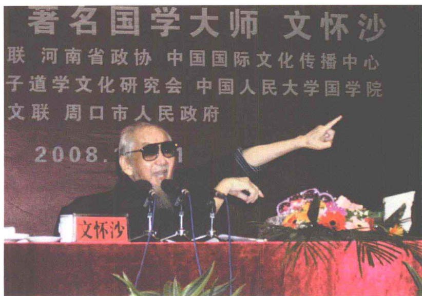
著名国学大师文怀沙先生出席 2008·中国鹿邑国际老子文化节「文 化名人讲坛」,并发表《大道有无中》 演讲