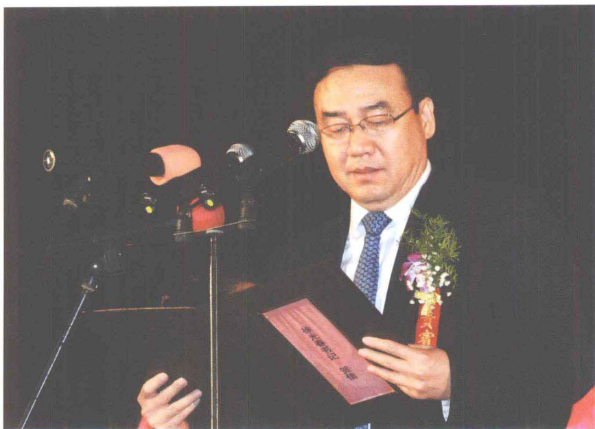
河南省人民政府副省长徐济超在2008·中国鹿邑国际老子文化节开幕式上宣读中共河南省委书记、省人大常委会主任徐光春贺信