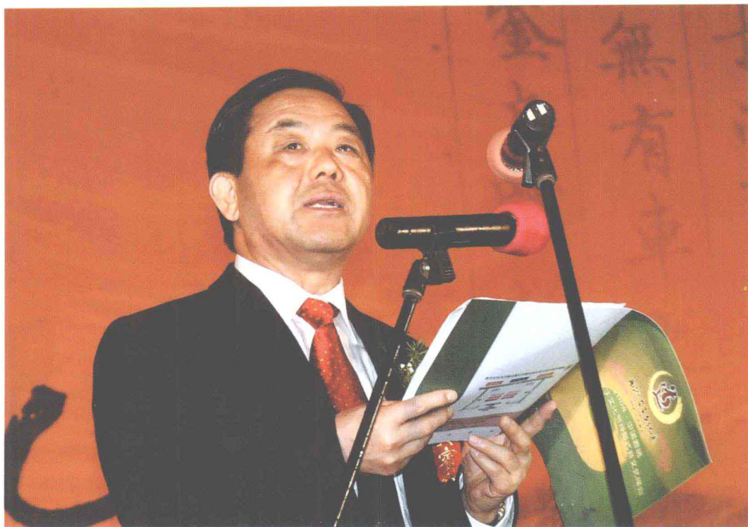
河南省政协主席王全书在 2008·中国鹿邑国际老子文化节开幕式上讲话