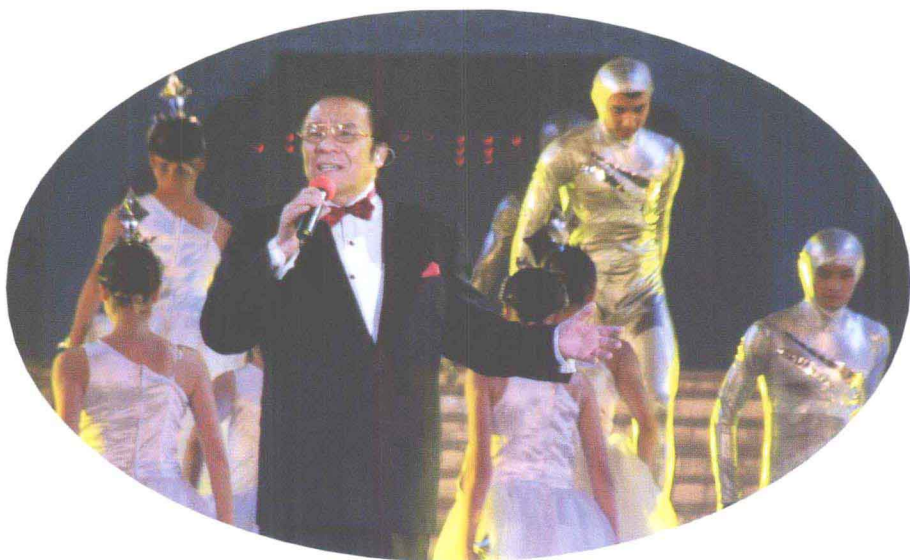
著名男中音歌唱家杨洪基在“天地人和”主题晚会上演唱歌曲《天上有颗鹿邑星》