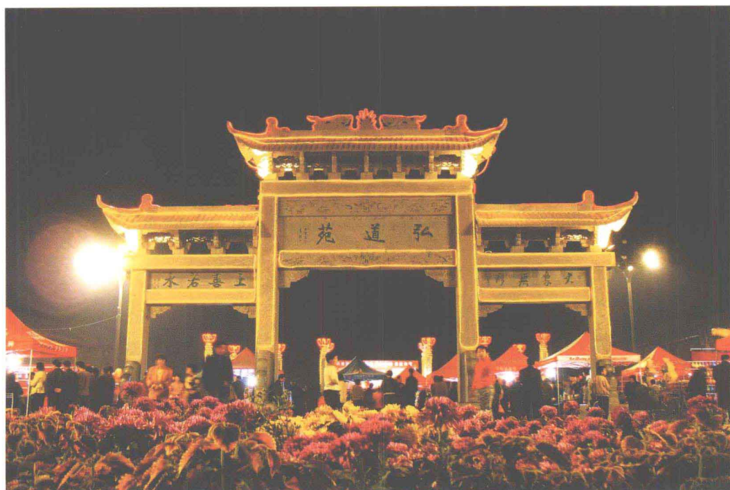
流光溢彩迎佳节——鹿邑县明道宫弘道苑夜景