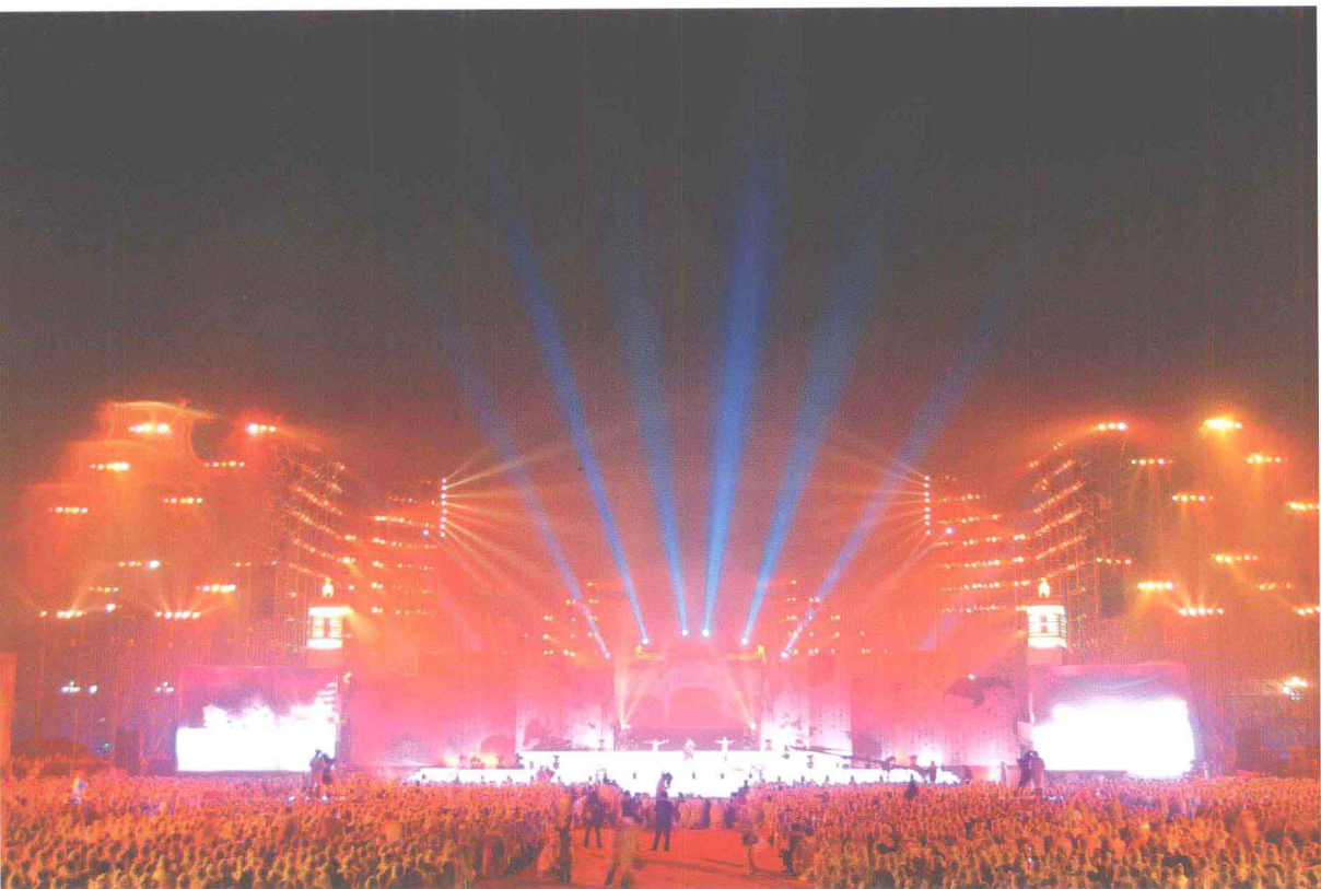
2008·中国鹿邑国际老子文化节“天地人和”主题晚会会场