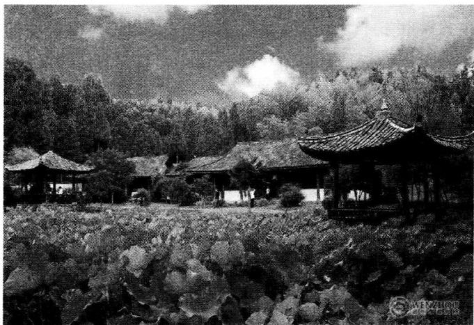
刘基故里——南田武阳村

刘基祖辈于六世祖尧仁时，始迁居于浙江丽水竹洲（今浙江省丽水县太平乡），其子刘集再次迁居于南田山武阳村（今浙江省文成县南田镇武阳村）。