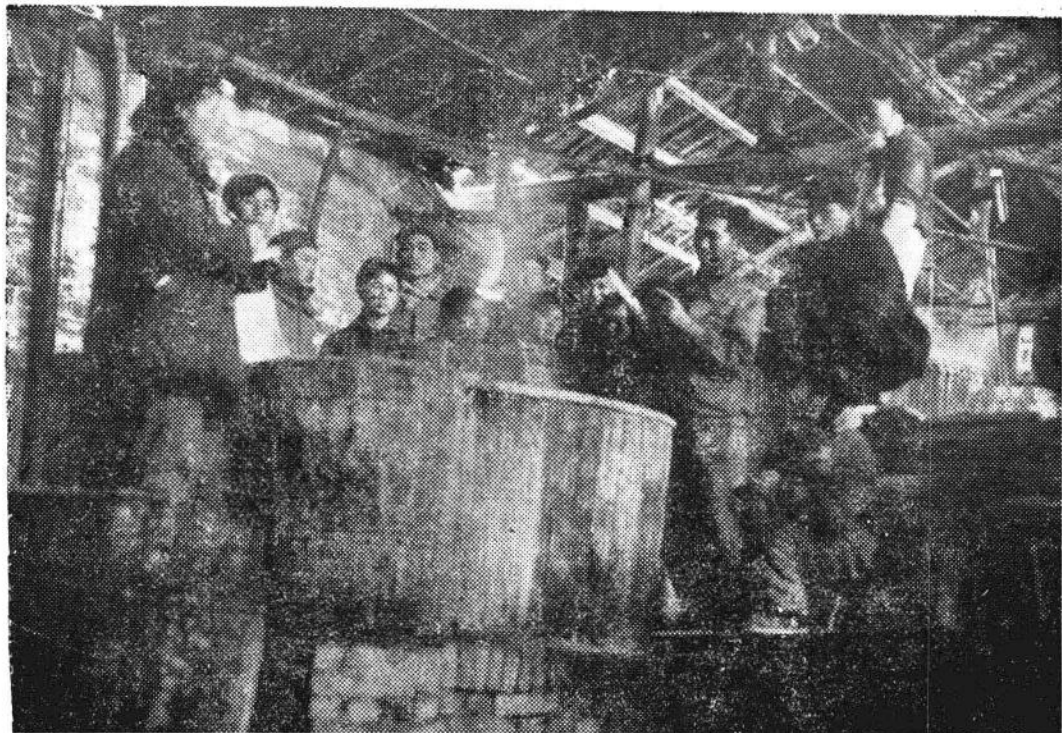
（此历史照片系当年的设备、厂房及工作场面）。