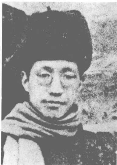
抗日戰爭前攝於北平北海