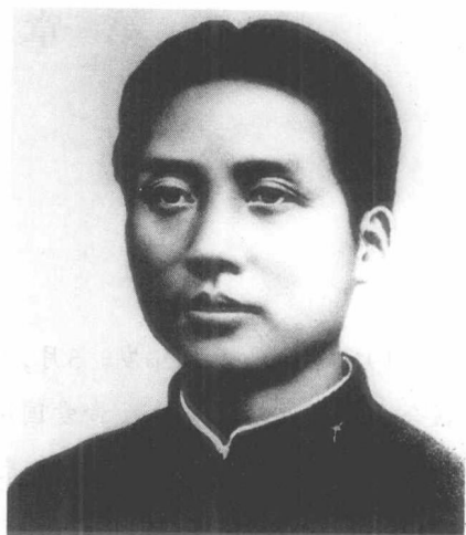
青年时代的毛泽东（历史照片）——

在1米82左右；加之阔额头、大眼睛、双眼皮，面容英俊，他出现在任何地方总是很醒目。