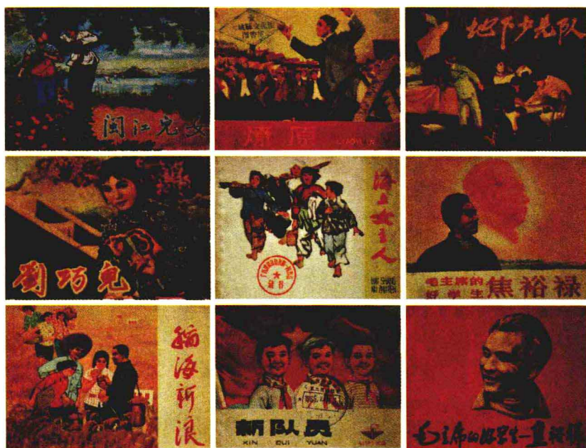
《海上女主人》和《闽江儿女》印量仅几千册，在老版连环画中相当稀少。