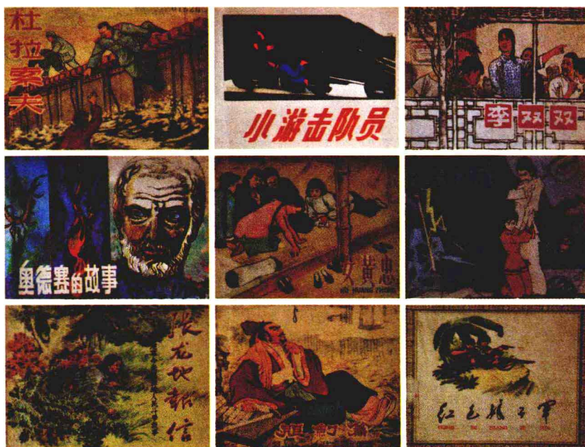
《红色娘子军》是“大众画库”42本中的一本，作者现存有套书中的32本。