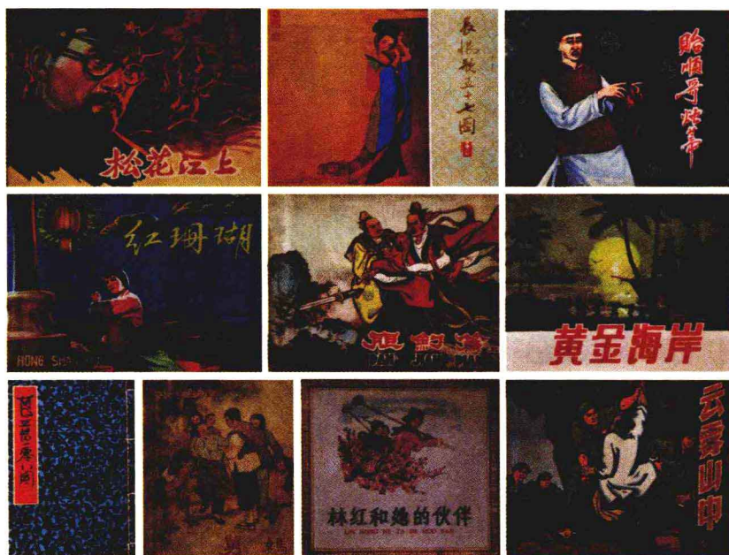
吴性清画的《舅妈》，1956年10月上海人美出版，市面上也很难见到此书了。