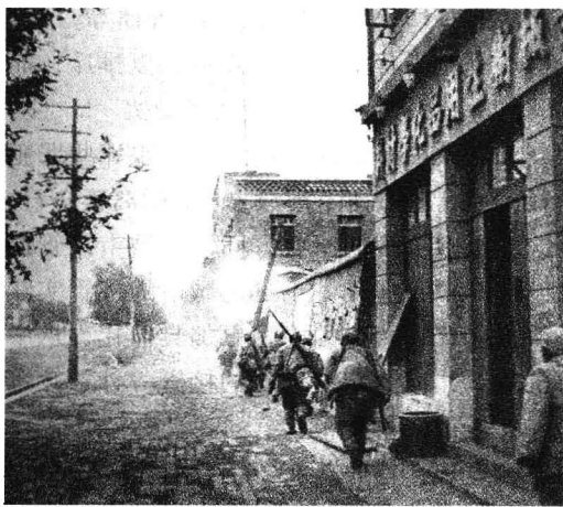
◎解放军攻入石家庄市中山路

晋察冀军区、野战军攻打石门的请示批准后，即着手开始制定攻克石家庄的战役行动计划。当时石家庄市的政治、军事、经济、文化是个什么状况呢？军区对此进行了及早的调查，掌握了石家庄市的基本社情和国民党的军、政、党、特的概况。石家庄市地处平（今北京）汉（口）、石太（原）、德（州）石几条铁路的交会处，因其战略位置重要，国民党常以一个军部、两个正规师及若干保安部队据守，以保持东西南北铁路畅通，并由大郭村空军飞机场辅之。石家庄人口近20万，官办大型工矿企业近20家，产业工人1万多人；私营中小工厂600多家，工人近3500名；大小工商业约80行，从业人员7万余人。市郊北、南、东置国民党南京联勤总部军用、民用仓库约10处，有大量的军用、民用品。石家庄市教育比较落后，全市中小学校70处，学生1万多名，教职员300多名，无大专院校。为统治石门市，国民党政府在石门设立了专员公署、石门市政府及公署下领的周围20多个县政府，及市政府直领的6个区公所。军统、