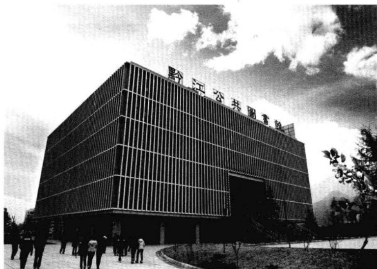
全国各级公共图书馆、文化馆（站）全部实行免费开放

加强公共文化服务体系建设的目标任务是，按照结构合理、发展平衡、网络健全、运行有效、惠及全民的原则，以政府为主导、以公益性文化单位为骨干、鼓励全社会积极参与，努力建设公共文化产品生产供给、设施网络、资金人才技术保障、组织支撑和运行评估为基本框架的覆盖全社会的公共文化服务体系，切实保障人民群众看电视、