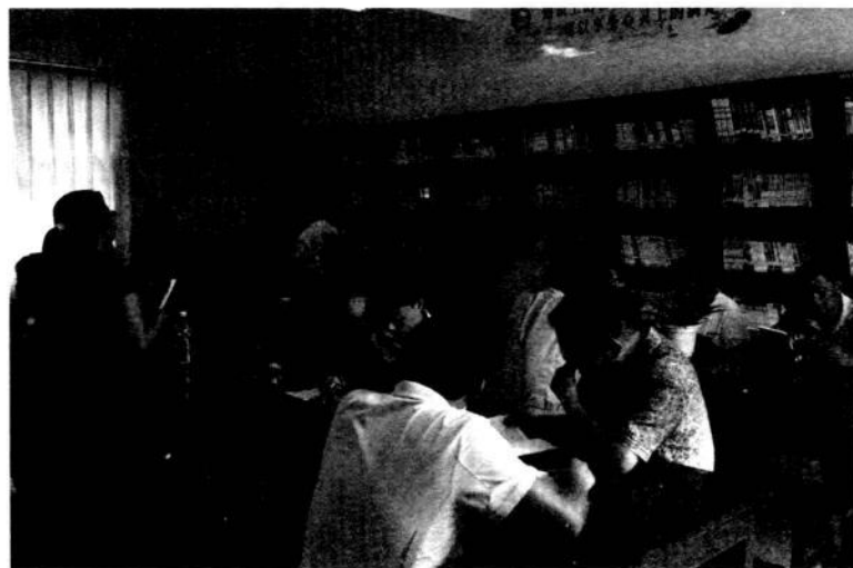
综合文化站图书室

乡镇综合文化站的具体职能有：对广大群众进行时政宣传和政策法规教育；组织开展丰富多彩的文体娱乐活动，组织和指导电影、电视、录相放映活动；利用全国文化信息资源共享工程举办各类文化艺术培训班、科普讲座、农技知识讲座等，辅导和培养文艺骨干；开办图书报刊室，组织群众开展读书读报活动；搜集、整理民族民间文化艺术遗产，促进乡村特色文化的发展；指导和辅导村文化室、农家书屋和农民文化户开展各种业务活动；做好当地的文物宣传保护工作；受上级文化主管部门委托协助管理当地文化市场。