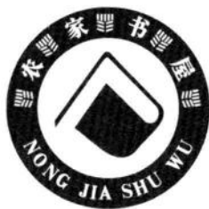
农家书屋标志、标牌

建设农家书屋，就是要引导农民群众多读书、读好书，丰富和活跃农村文化生活，提高农民群众的科学文化素质，引导农民群众用知识改变自己的命运，改变家乡面貌，建设和谐美好的社会主义新农村。