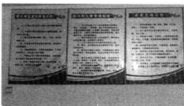
室内制作各种制度