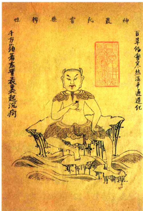
↑发明农业和医药的神农氏

敬献给周武王。晋常璩著的《华阳国志》中记载：“周武王伐纣，实得巴蜀之师，……茶蜜……皆纳贡之。”武王伐纣的时间在公元前1066年前后，由此可见，中国有明确记录的茶事活动距今至少已有3000年的历史了。