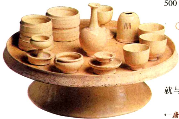
←唐·白釉高足盘及器皿

有句俗话说“吃茶是和尚家风”，僧侣与品茶之风有着极其密切的关系，茶道从一开始萌芽，就与佛教有着千丝万缕的联系，旧时