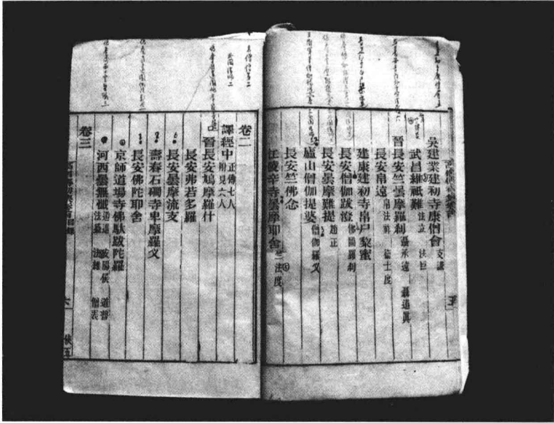
陳寅恪寫有批語之高僧傳初集目錄