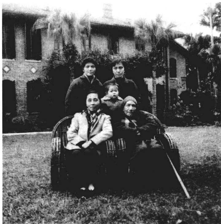
陳寅恪夫婦與長女流求、次女小 彭、流求女景宜攝於廣州中山大學 東南區一號北面草坪 一九五九年十二月二十四日