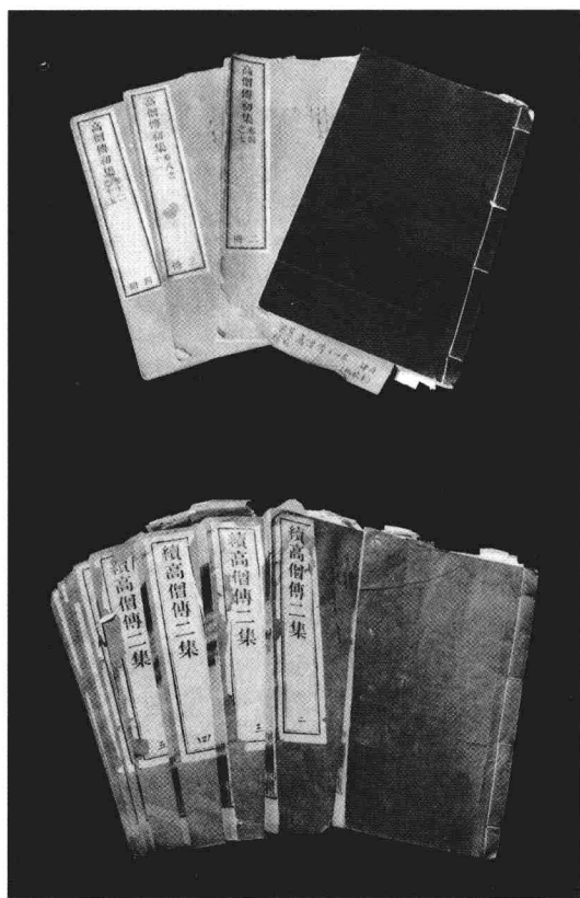
陳寅恪批校之高僧傳初集、二集