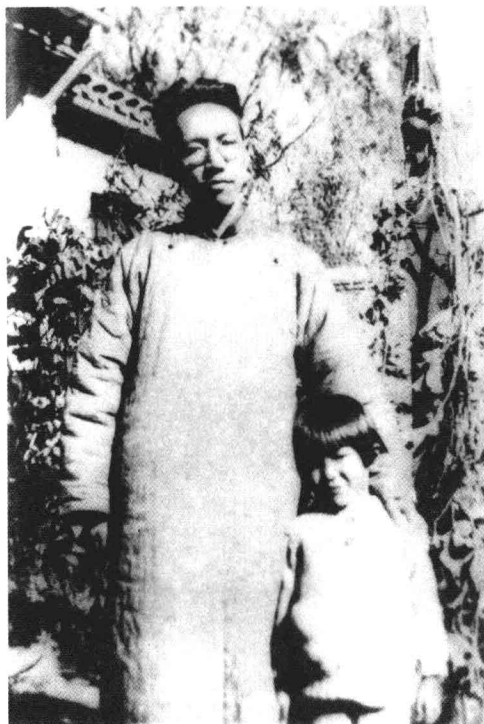
與長女流求攝於北平清華大學西院 三六號 一九三五年秋