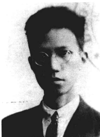
青年時代留學國外時護照相