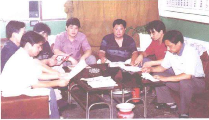
运管所领导班子进行政治学习