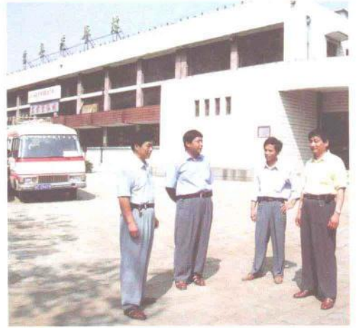
汽车站领导成员坚持现场办公，现场解决问题。