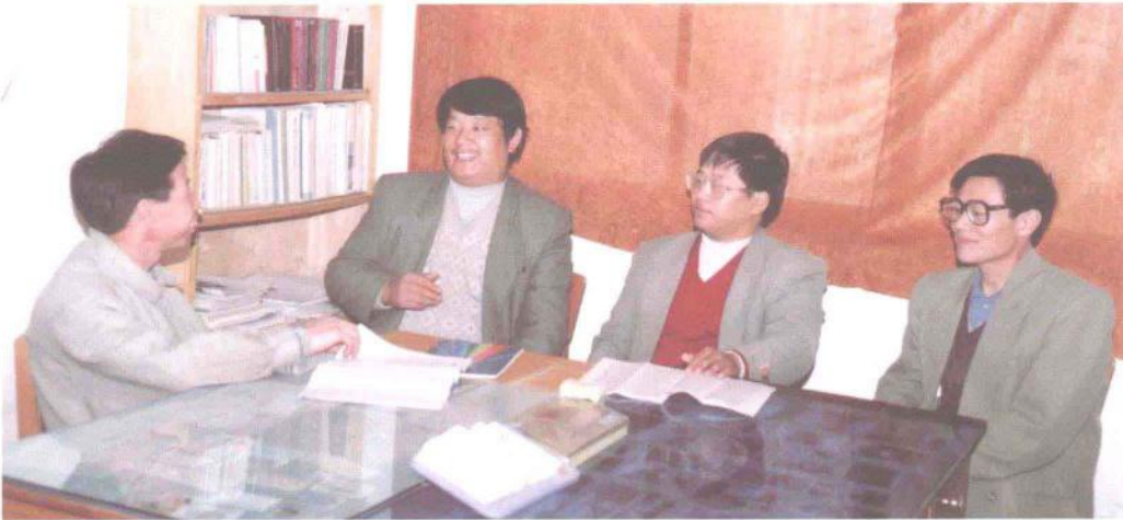
县乡公路管理所领导班子成员在研究县乡公路规划