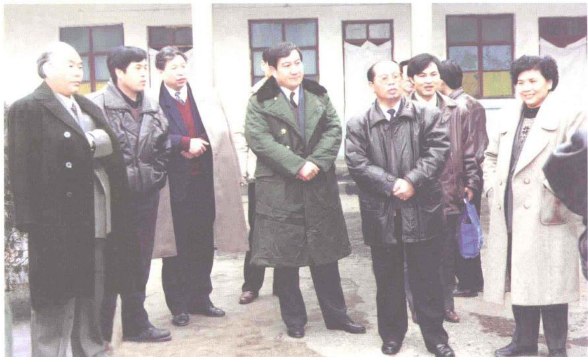
1995年，国家交通部部长黄镇东（左五）在嵩县柏坡道班了解情况