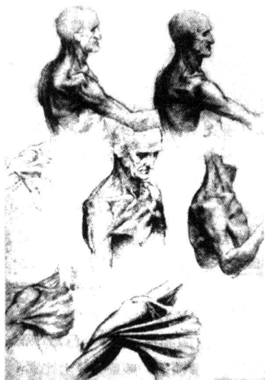
艺术家达·芬奇的解剖素描

科学主义，是与近现代自然科学的发展紧密联系在一起，它指称的是科学研究的典型方法和态度，如科学是对真知的追求，是对自然乃至社会规律的揭示；科学知识是最为客观、最接近实在的知识；科学的统一在于它的方法而非材料。实证、理性、臻美等构成科学主义的典型特征。科学具有巨大的精神力量和物质力量，是推动文明进步和造福人类的源泉之一。随着自然科学的发展及其向生活的渗透，人们的社会生活存在着逐渐技术化、科学化的倾向，因而科学主