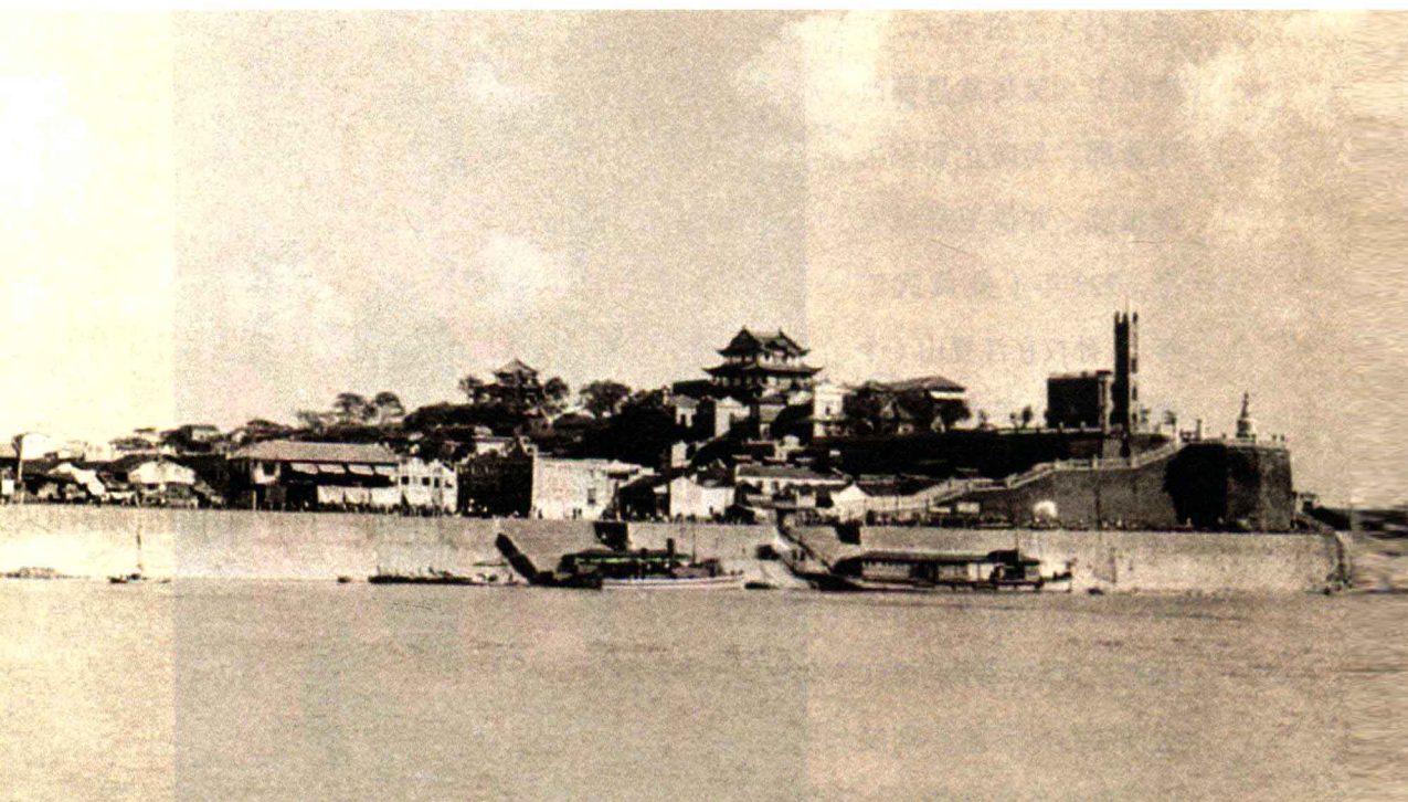
蛇山黄鹤矶老照片

而命名：此楼脚下的山矶名“黄鹤矶”，江湾名“黄鹤湾”。古时，这一带天鹅繁衍栖息，天鹅亦称黄鹤，山矶又呈黄褐色，其状若飞。“鹤”转音为“鹤”，二字互相通假，黄鹤楼便因山得名。二是因仙而命名：传说王子安、费祎、荀瑰等仙人驾黄鹤或盘绕或休憩于此楼。两种说法并行不悖，但以第一种说法最为盛行。