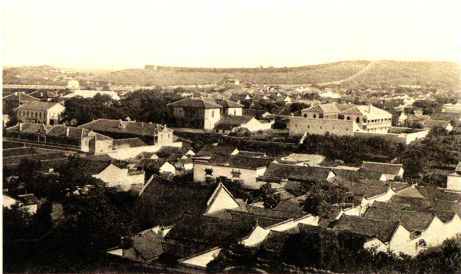
武昌山势与城墙老照片

黄鹤楼所在的武昌，早在3至4亿年以前的泥盆纪和石炭纪时期，还是一片汪洋的浅海区。以后，随着地壳运动，海水退出，海陆交替变迁，海底被隆为陆地，再被掀起为山，渐渐形成了数列山系，此起彼伏，宛如