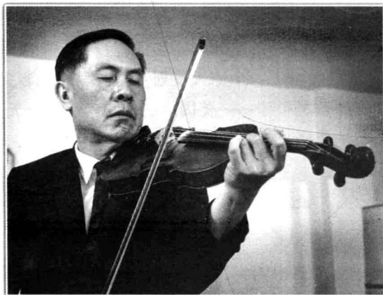
20世纪50年代的马思聪