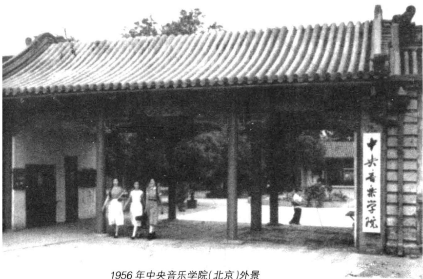
1956年中央音乐学院(北京)外景