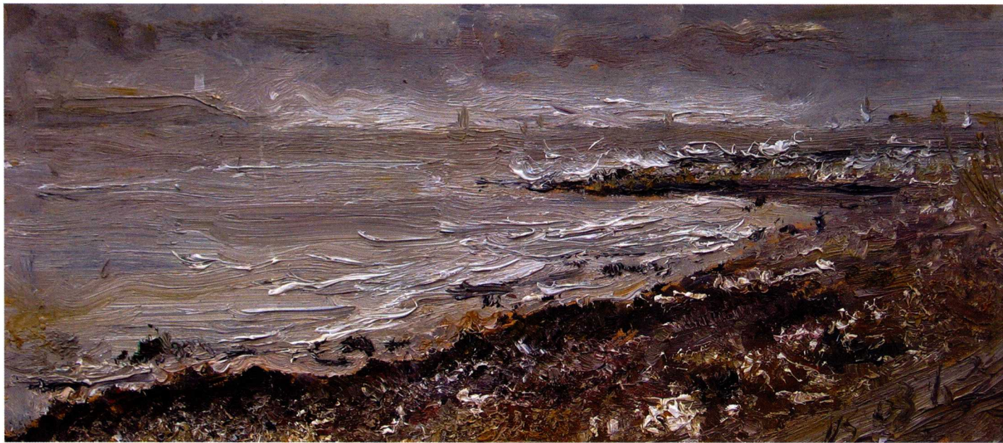
长江浅滩（一） 2002. 12 油画 23 × 55cm