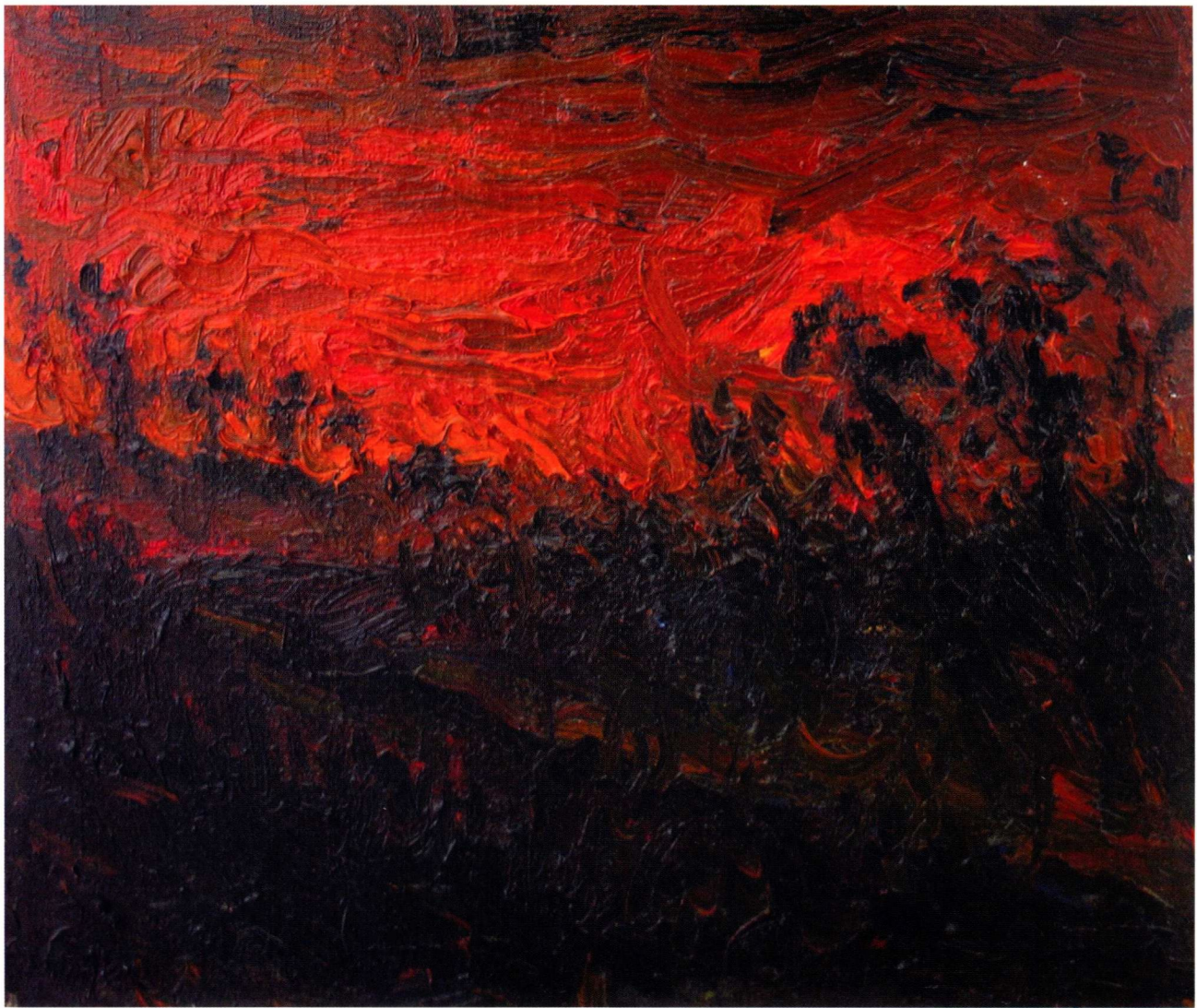
黄昏暮色 2002. 12 油画 38 × 45cm