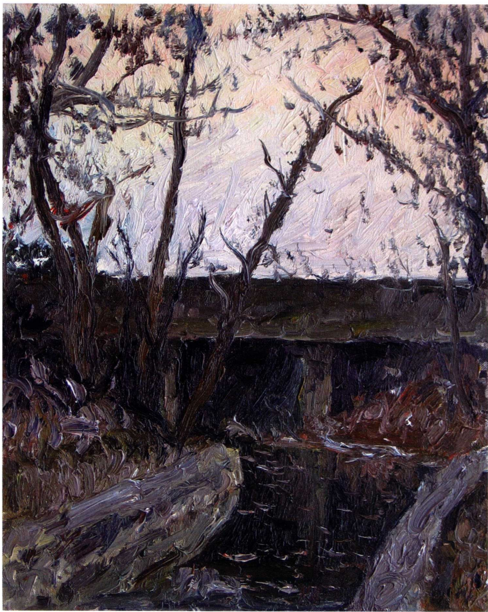
路边水渠 2002.12 油画 41 × 33cm