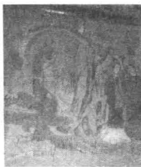
前人根据唐人传奇《枕中记》所画的《黄粱梦》

唐传奇的出现，标志着中国古代文言短篇小说趋于成熟。鲁迅在《中国小说史略》里说：“叙述宛转，文辞华艳，与六朝之粗陈梗概者较，演进之迹甚明。”中唐以后，唐传奇到达兴盛期，和唐诗、唐文一样达到了绚烂之境。它通过生动的故事描写和人物刻画，展现了唐代社会丰富多彩的生活画卷，多层次地反映了人们的生存状态、生活理想、道德观念和价值观取向。