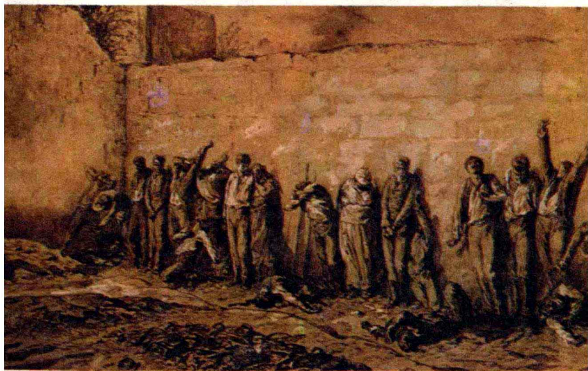
贝尔—拉雪兹公墓的巴黎公社社员墙