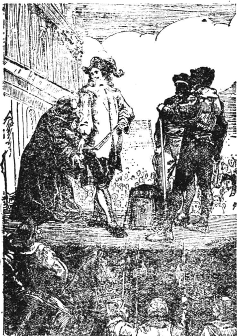
查理一世被押上断头台

克伦威尔的独裁统治 共和国成立以后，克伦威尔独揽大权，成为实际的军事独裁者。他竭力维护资产阶级和新贵族的既得利益，完全不顾人民的死活，甚至掉过头来，同人民为敌，在国内镇压掘地派运动，又出兵“远征”爱尔兰。