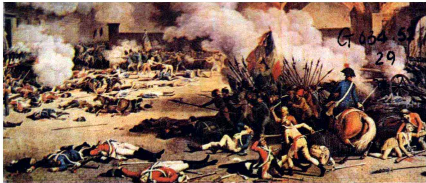
巴黎人民攻占杜伊勒里宫 (1792年8月10日)