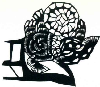
犬戏花球 (窗花) 山东高密 任凭 7.6cm × 8.8cm

The Dog Plays with a Flower Ball (window decoration) Gaomi, Shandong Ren Ping 7.6cm × 8.8cm