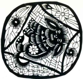
“福祿壽喜”十二属相之“禄”狗 山东高密 范祚信 9.9cm × 10.5cm

The Dog with Official Rank Gaomi, Shandong Fan Zuoxin 9.9cm × 10.5cm