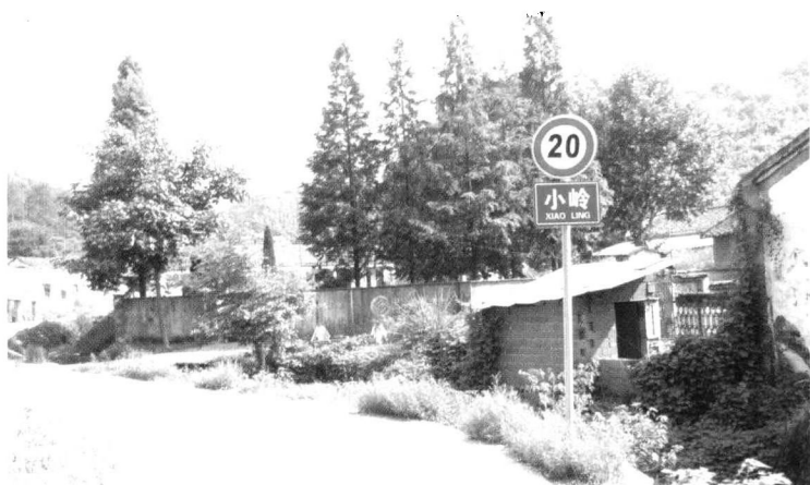
九岭十三坑中心地——小岭