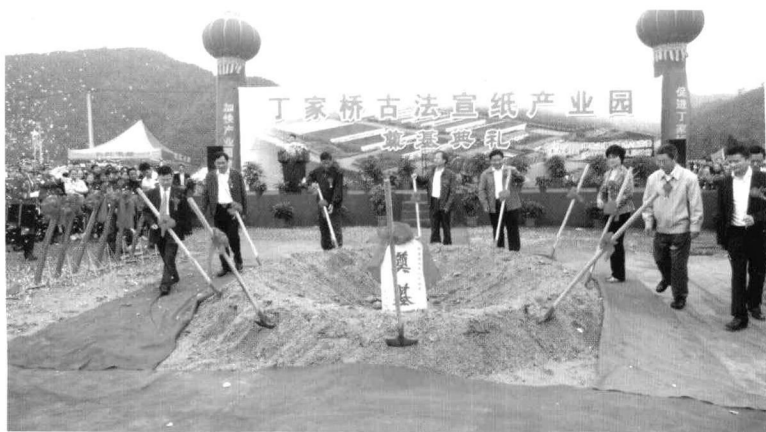
2011年10月2日丁家桥古法宣纸产业园奠基典礼