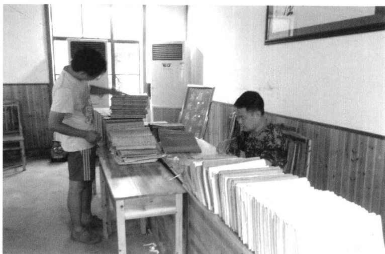
课题组成员在古檀山庄整理资料