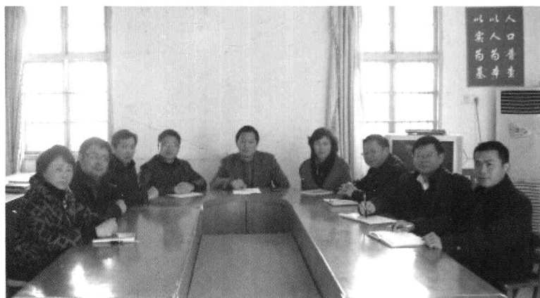
丁家桥镇现任领导班子成员合影