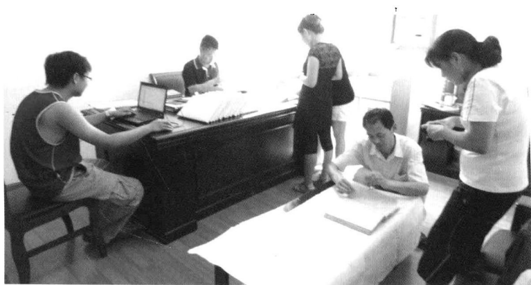
国家课题组成员和工作人员在查阅资料