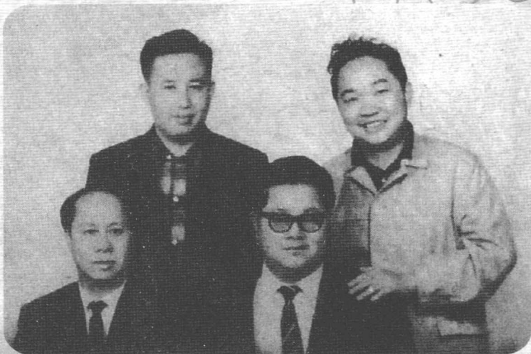
左上 卧龙生，前右 诸葛青云，右上 古龙。