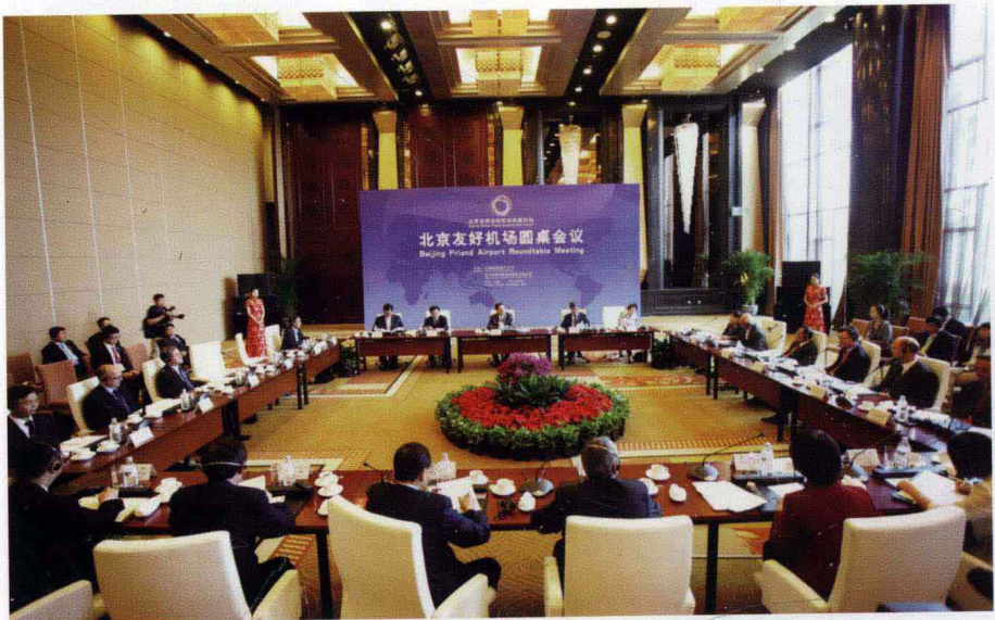
2011年10月14日北京友好机场圆桌会议