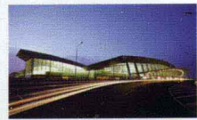
武汉天河国际机场