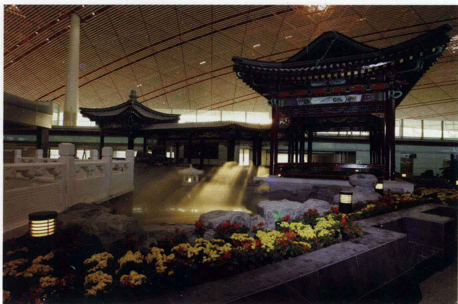
文化国门：北京首都国际机场 T3 航站楼景观——御园谐趣