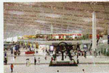
北京首都国际机场 T3 航站楼景观