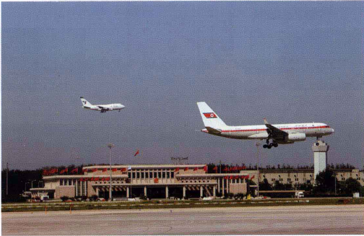
北京首都国际机场专机楼