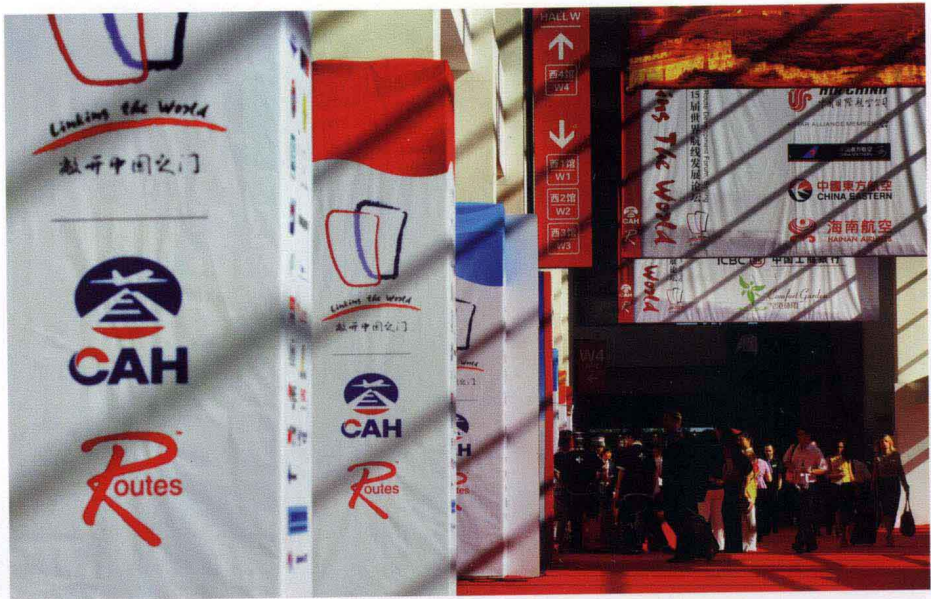
2009年，首都机场承办年度世界航线论坛