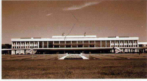
北京首都国际机场 T1 航站楼