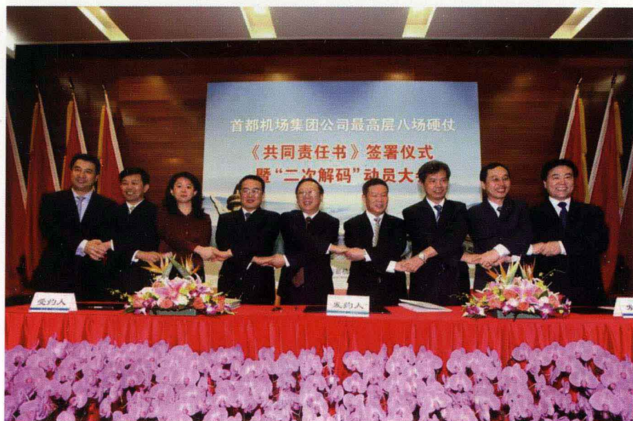
首都机场集团公司战略解码动员大会