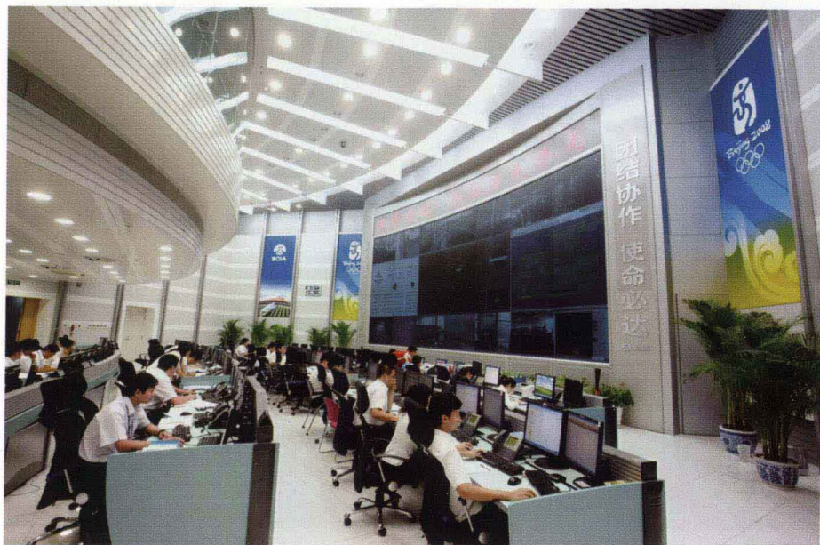
2008年北京奥运保障期间的北京首都国际机场运行控制中心