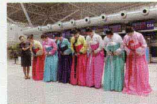
长春龙嘉国际机场