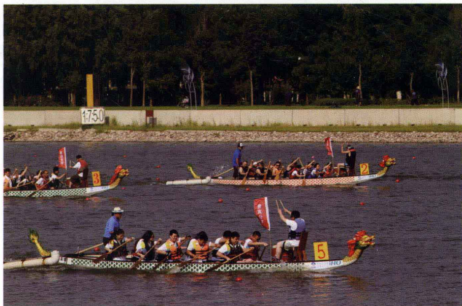
首都机场集团公司举办员工龙舟赛