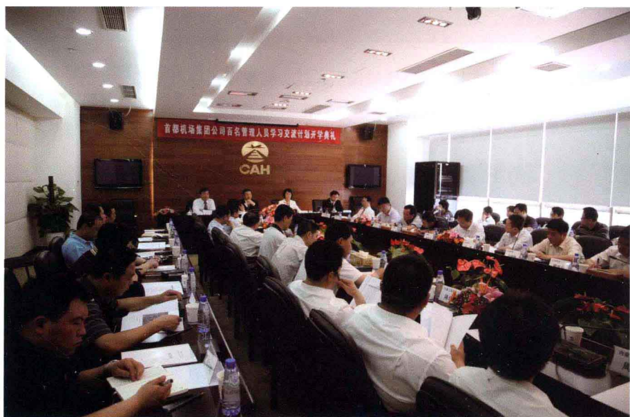
首都机场第一期百名管理人员学习交流计划开学典礼