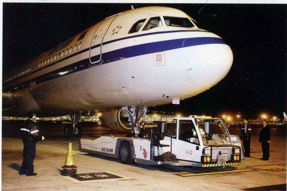
2008年，北京首都国际机场 T3 航站楼转场启用——航空器夜间转场