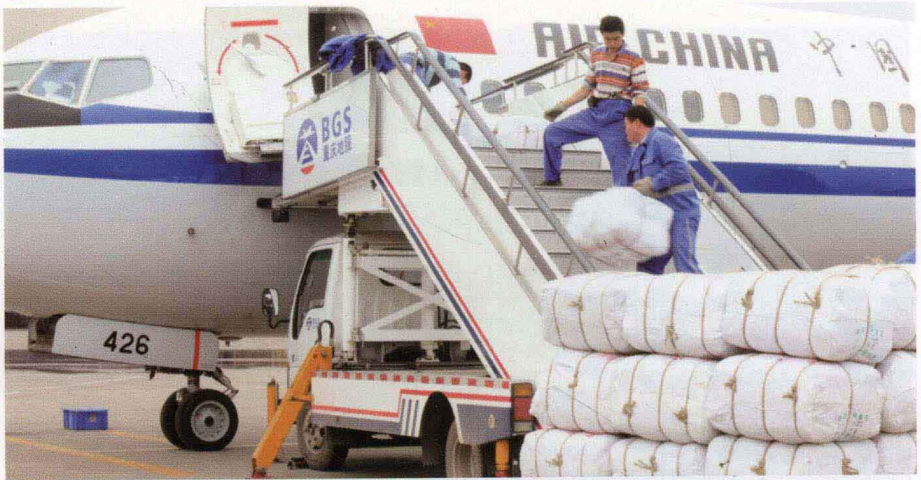
重庆机场特事特办，为玉树赈灾开辟快速绿色通道