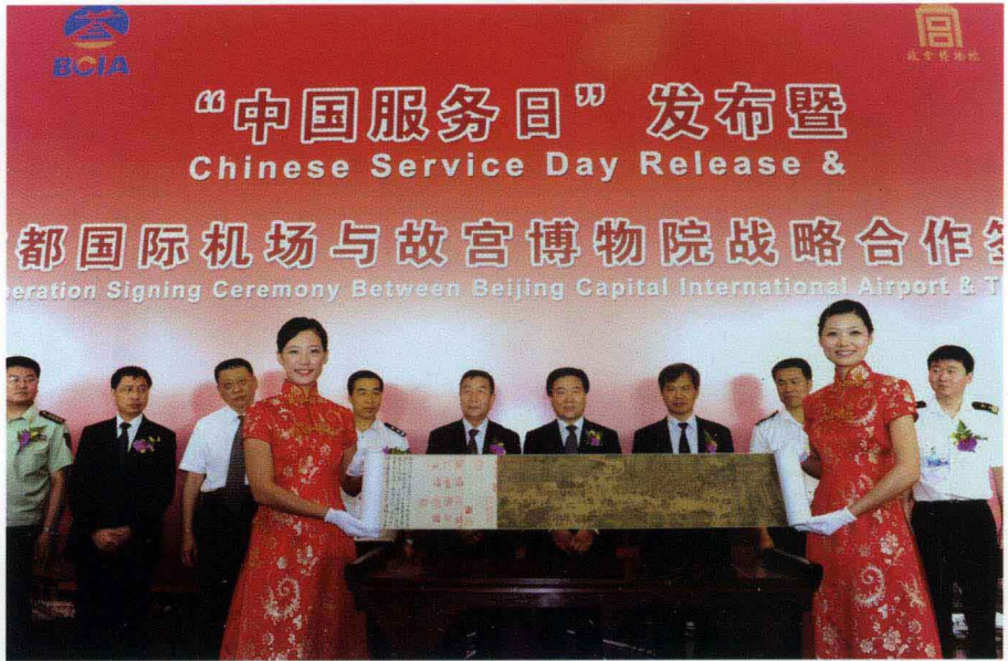
首都机场将每年的6月25日作为“中国服务日”， 图为2010年6月25日，首都机场与故宫博物院战略合作签字仪式