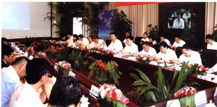
首都机场集团公司党组中心组学习《国务院关于促进民航业发展的若干意见》