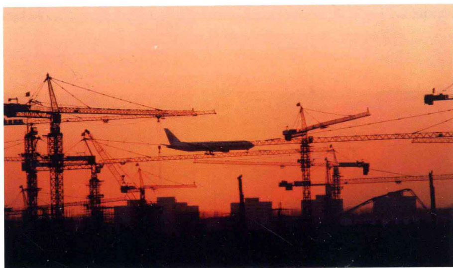
建设中的航空大都市