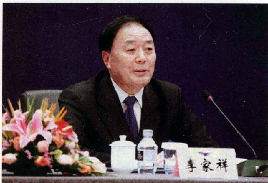
中国民用航空局局长李家祥莅临首都机场大讲堂， 作了题为“紧密团结协作，展示国门形象”的专题讲座