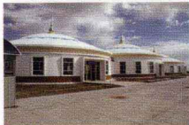
呼和浩特白塔国际 机场辅助航站楼