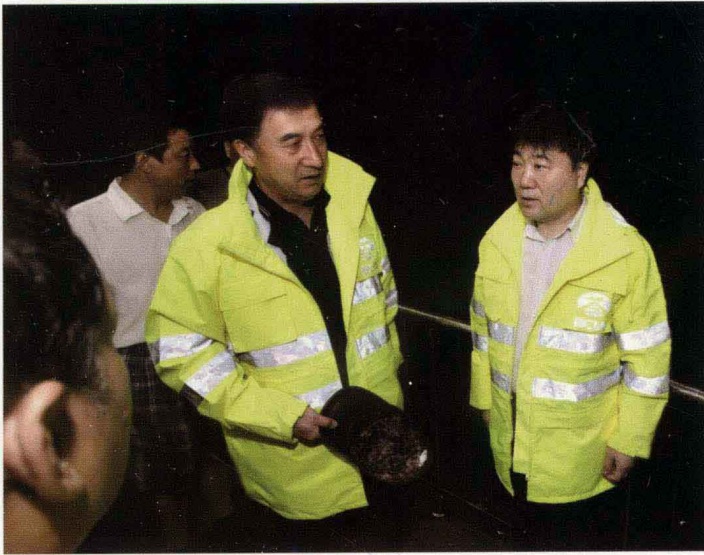
2012年7月21日，首都机场集团公司领导现场指挥防汛工作