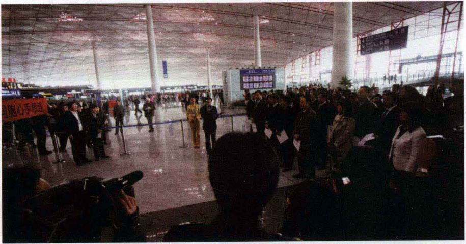
2010年，首都机场集团在T3航站楼为玉树遇难同胞举行哀悼仪式， 并捐款1497万元