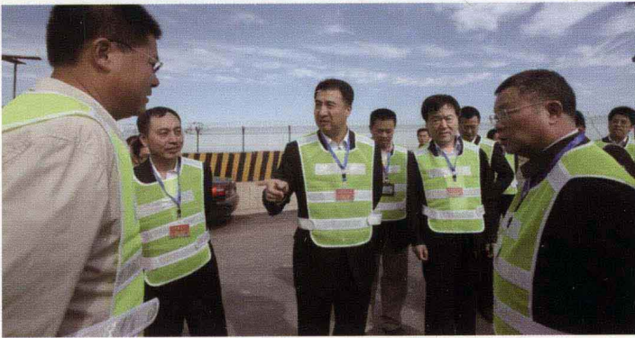
首都机场集团公司领导在一线检查指导安全工作