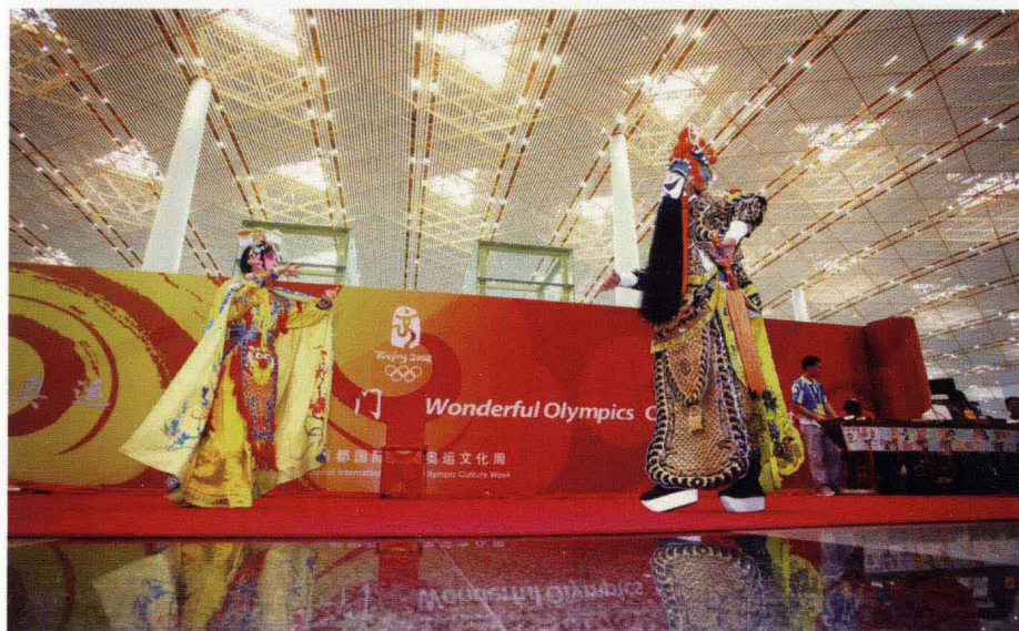
文化国门：北京首都国际机场航站楼文化特色展