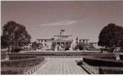
北京首都国际机场第一座航站楼