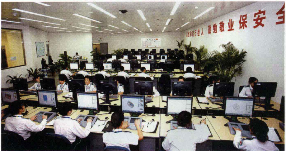
首都机场的五级安检服务