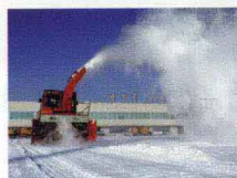
哈尔滨太平国际机场