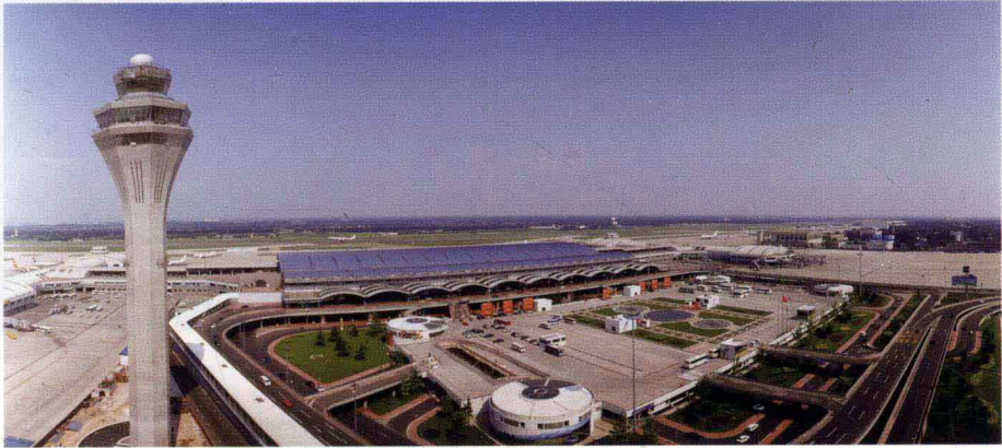
北京首都国际机场塔台与 T2 航站楼