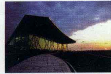
天津滨海国际机场