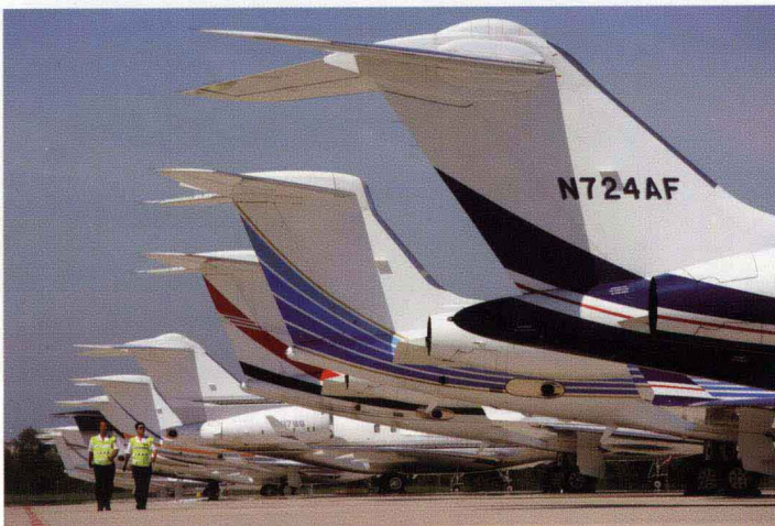
地面执勤人员在机坪上巡逻