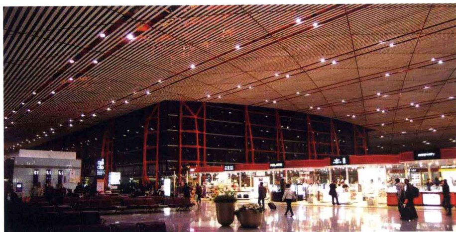
繁荣的航站楼商业