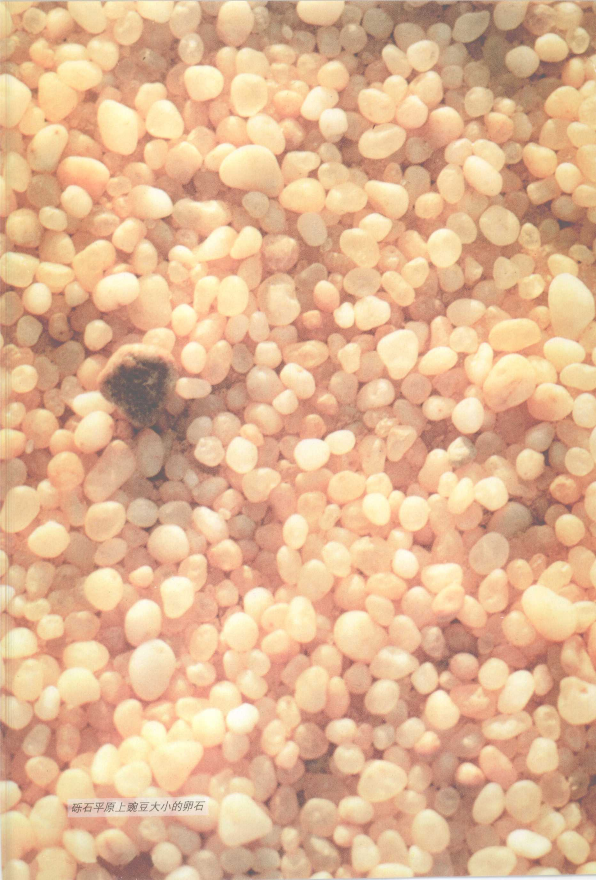
砾石平原上豌豆大小的卵石