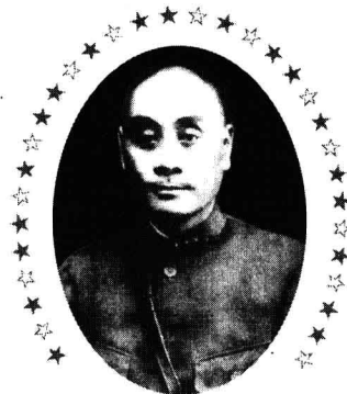
一世枭雄出师未捷身先死