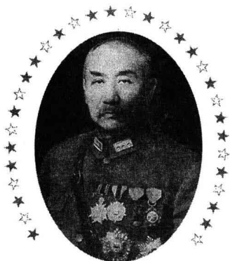
三颗鸡蛋上跳舞的“不倒翁”