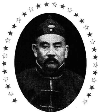
“辫子大帅”的复辟闹剧