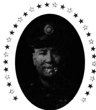
八桂骁将的最后抉择