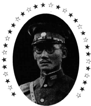
矮将军屡战群雄堕入蒋氏陷阱