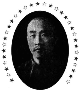
“草莽英雄”被诱杀谁之过