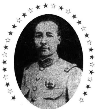
五省联帅放下屠刀难成佛