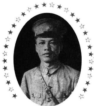
在拥蒋反蒋中起伏沉降