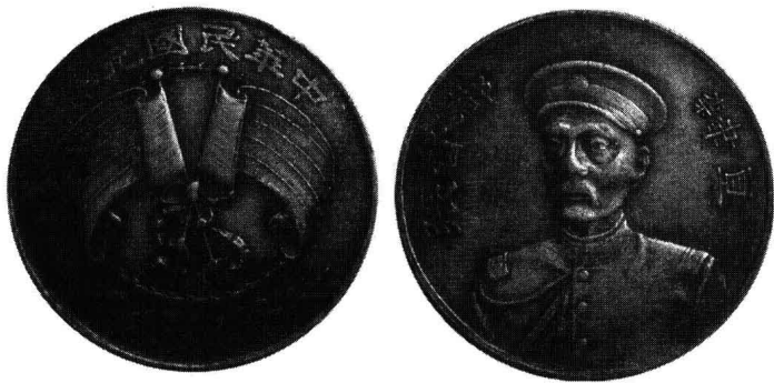
民国元年直隶张都督纪念币