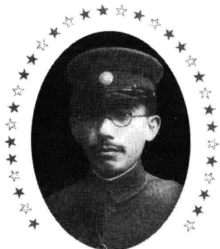
“佛教将军”崛起北伐倒蒋梦难圆