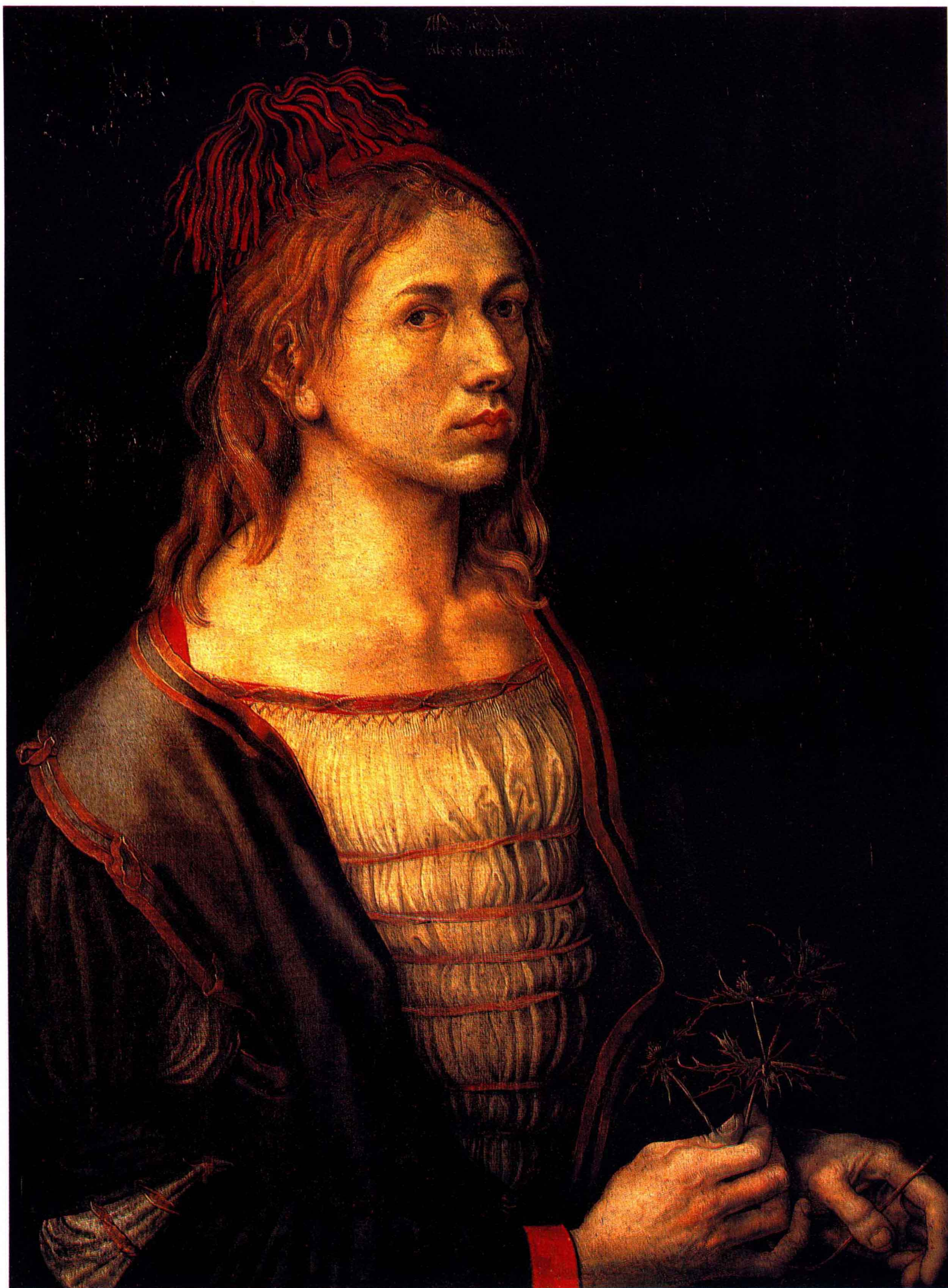
7 手持象征忠诚的艺术家 皮纸粘在画布上 57×45 丢勒(Albrecht DÜRER, 1471—1528)德国画家