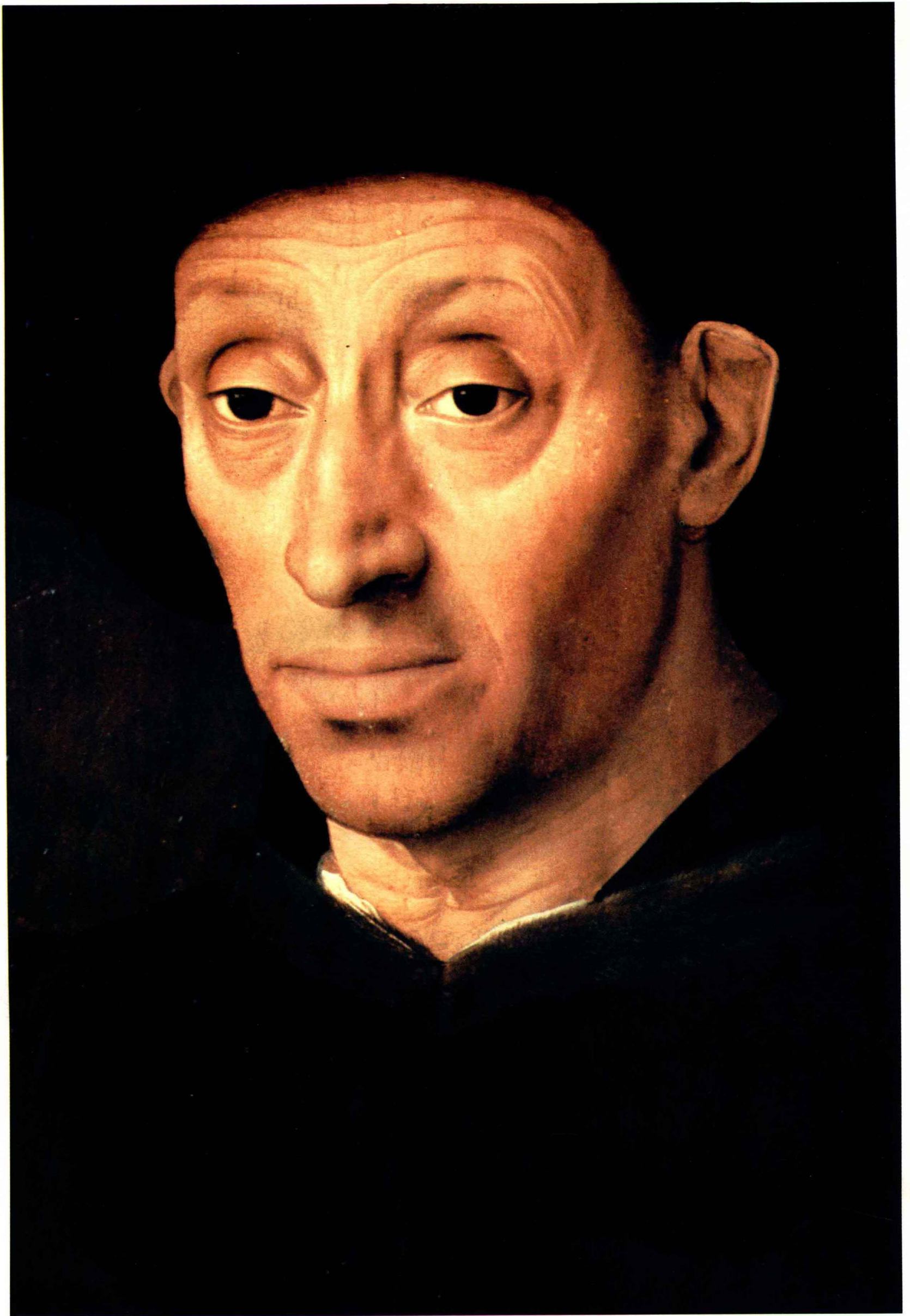
3 拿酒杯的男人(局部) 木板 63×43.5 十五世纪中叶的葡萄牙画派