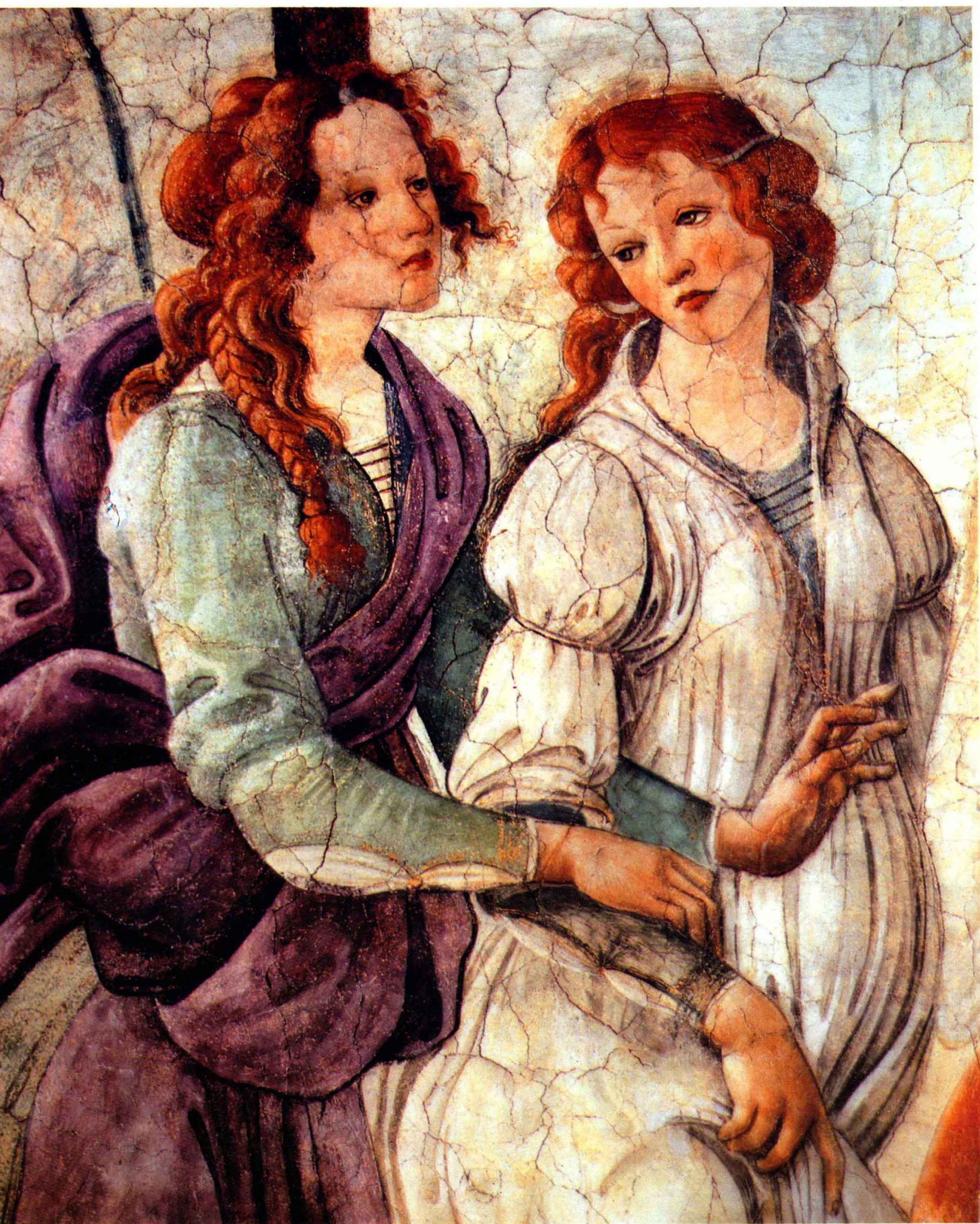
5 维纳斯和美惠三女神（局部）湿壁画 211×283 波提切利