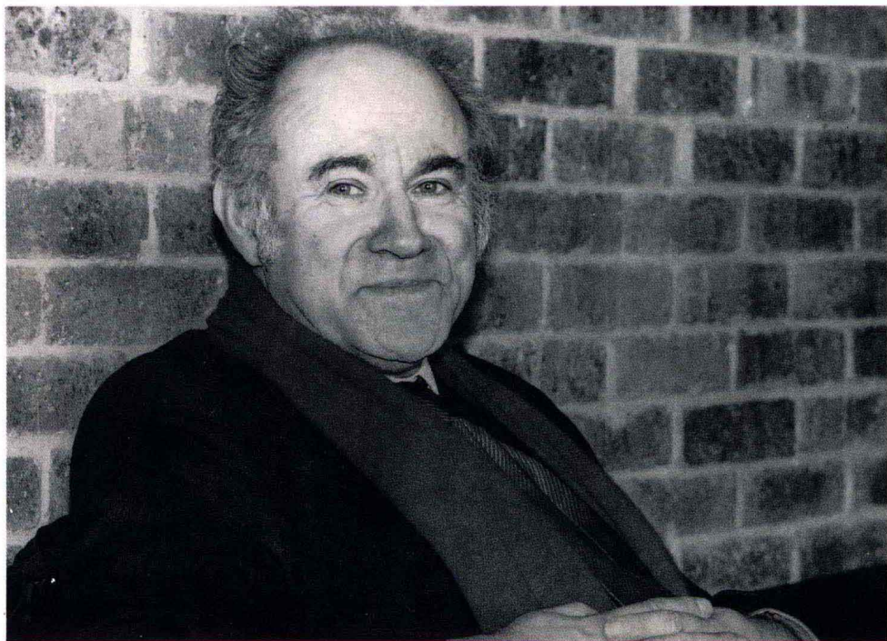
皮埃尔·罗森贝尔 卢浮尔博物馆文物总监 绘画馆馆长