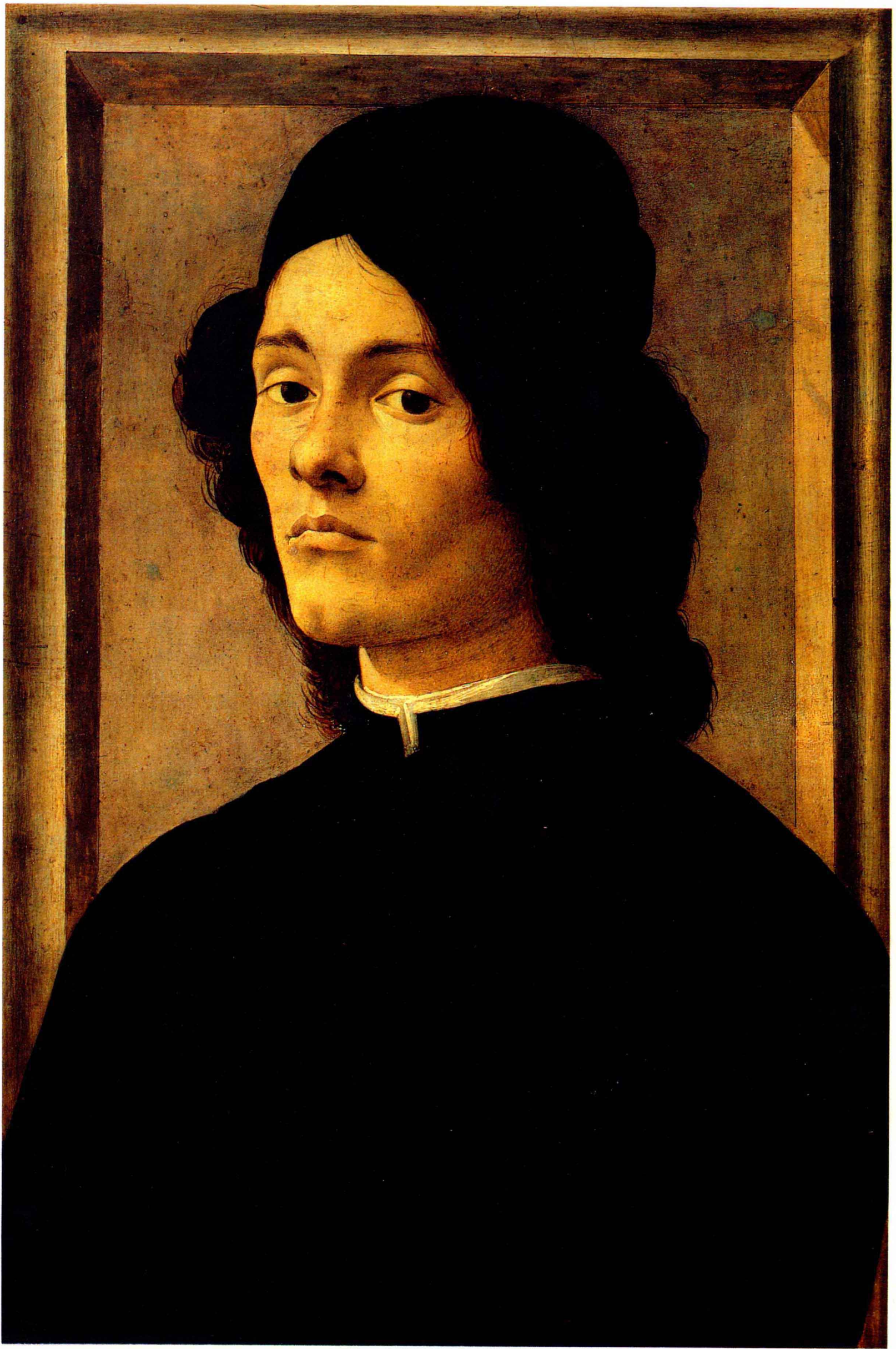
4 一个青年男子的画像 木板 57×39 波提切利(Sandro BOTTICELLI, 1445—1510)意大利画家