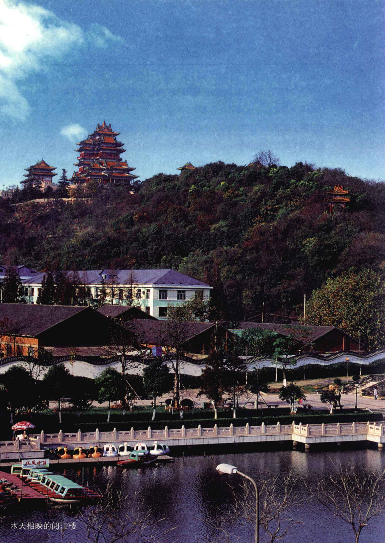
水天相映的阅江楼