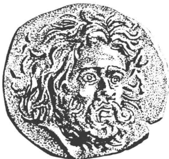
公元前3世纪的一块金币，发现于克里米亚 (Crimea) 的潘提卡帕乌姆 (Panticapaeum)，即今刻赤 (Kerch)

退并进入青铜时代，原始的农业社会开始在欧俄的黑土带上出现了。其中最著名的当属繁荣于公元前5500年～前2750年的三野文明 (Tripillian culture)——它得名于基辅以南的三野村 (Tripolye) 地区。