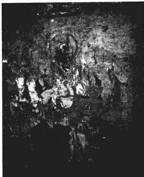
贞观十六年敦煌壁画君臣听法图

戴胄与珪同知国政，尝因侍宴，太宗谓珪曰：“卿识鉴精通，尤善谈论，自玄龄等，咸宜品藻。又可自量孰与诸子贤。”对曰：“孜孜奉国，知无不为，臣不如玄龄。每以谏诤为心，耻君不及尧、舜，臣不如魏徵。才兼文武，出将入相，臣不如李靖。敷奏详明，出纳惟允，臣不如温彦博。处繁理剧，众务必举，臣不如戴胄。至于激浊扬清，嫉恶好善，臣于数子，亦有一日之长。”太宗深然其言，群公亦各以为尽己所怀，谓之确论。