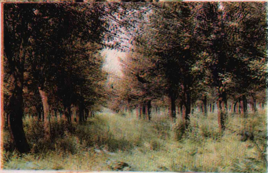
大河屯乡刘楼村委梨园一角