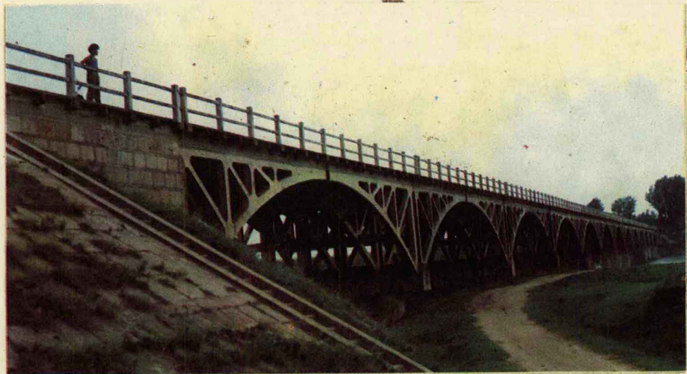
大河屯乡车厢店大桥