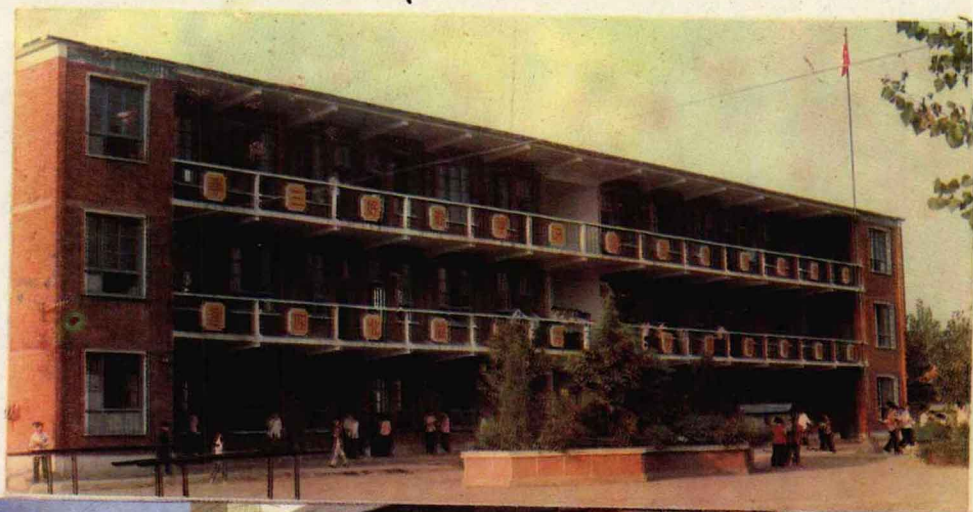
大河屯乡第一初级中学 教学大楼