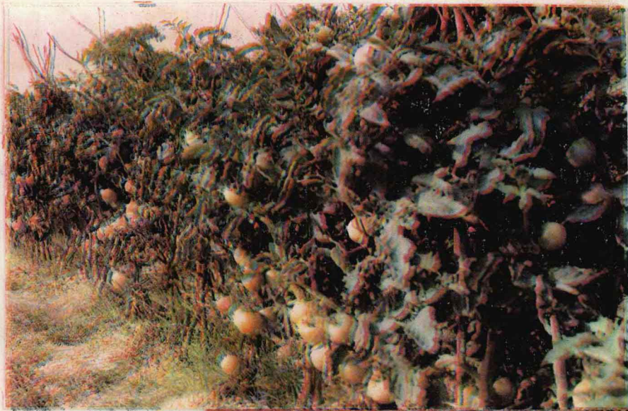
大河屯乡王老庄村委蔬菜(西红柿)