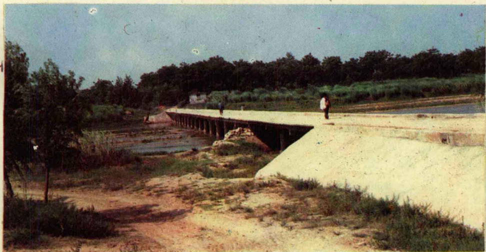
大河屯乡车风灌渠拦河坝