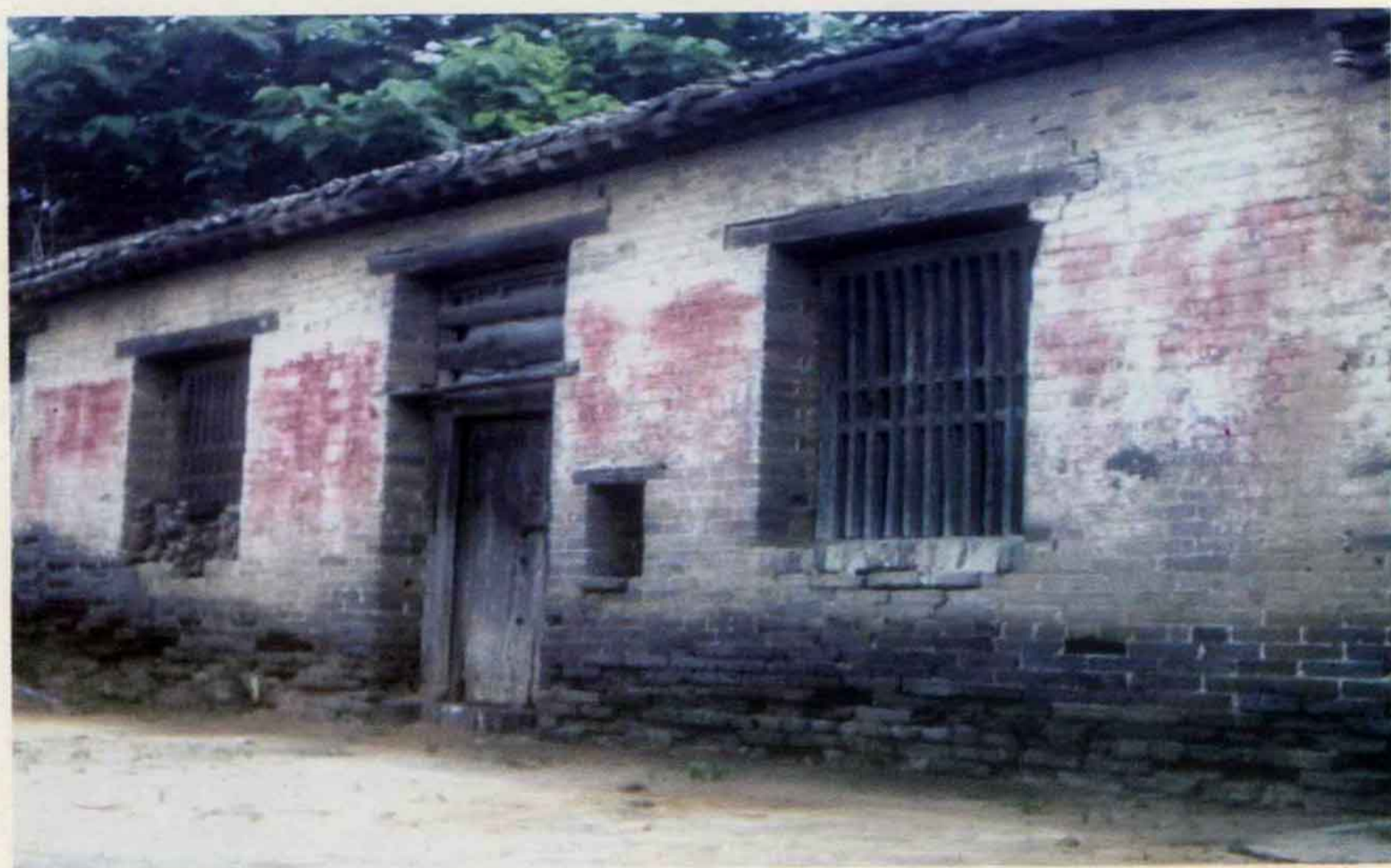
冀鲁豫区党委诞生地旧址（西王什）