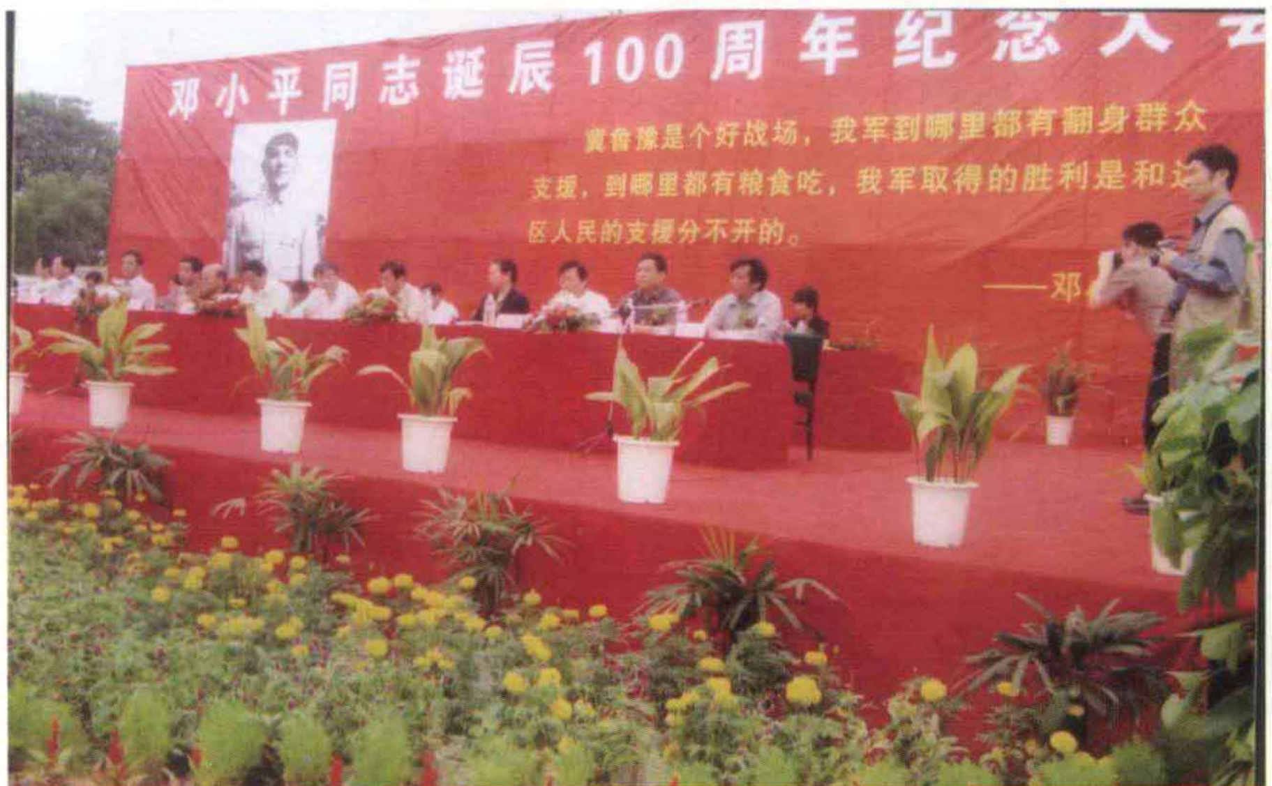
清丰县党政军民在单拐革命旧址举行邓小平同志诞辰100周年纪念大会