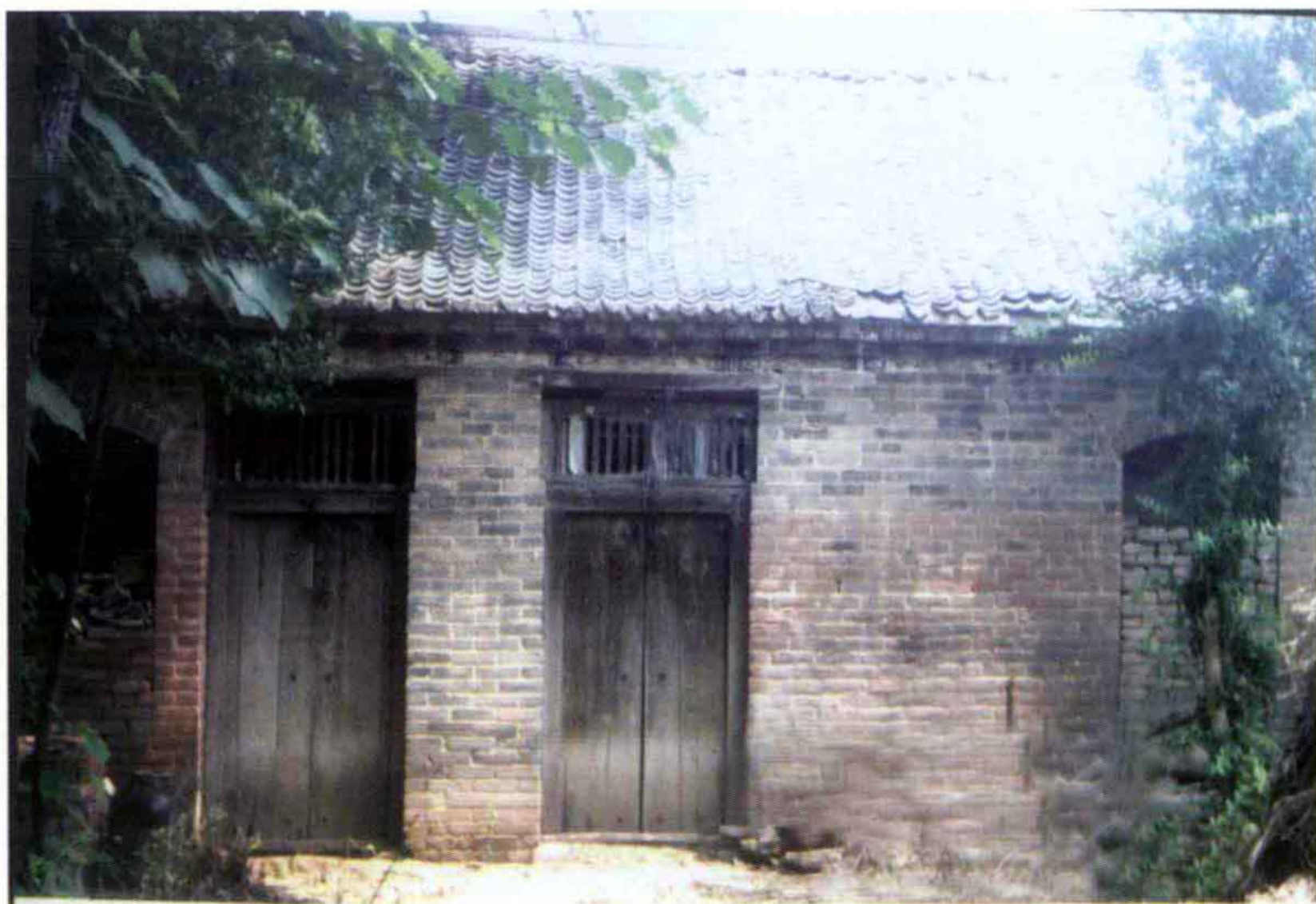
直南特委旧址（梁村）