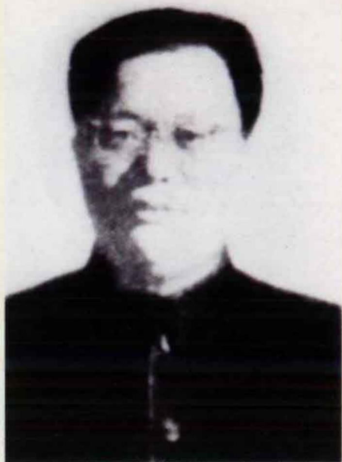
黄敬 中共平原分局书记 冀鲁豫军区政委