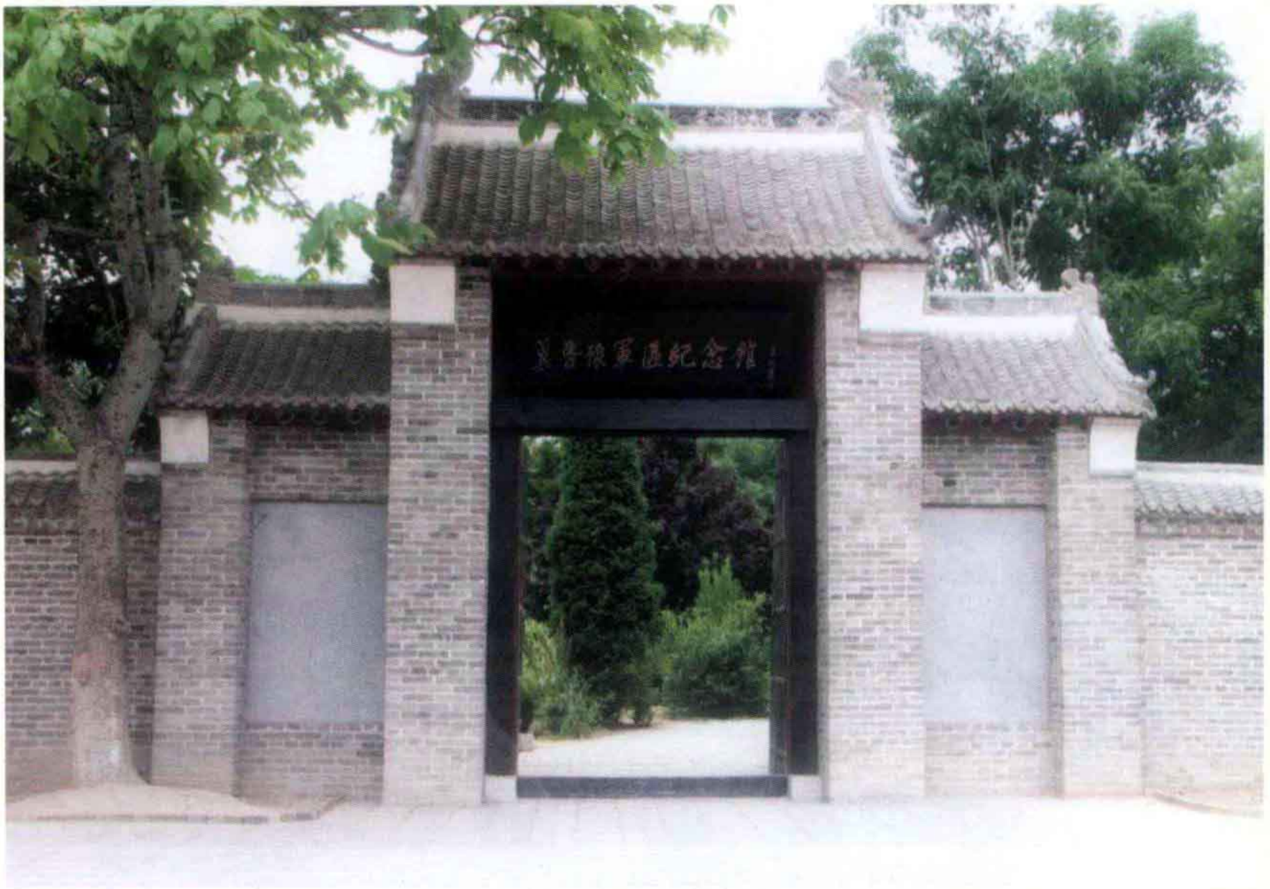
冀鲁豫军区纪念馆（单拐）