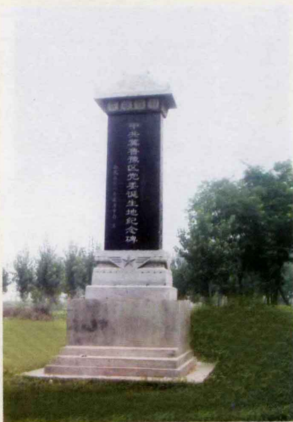
冀鲁豫区党委诞生地纪念碑