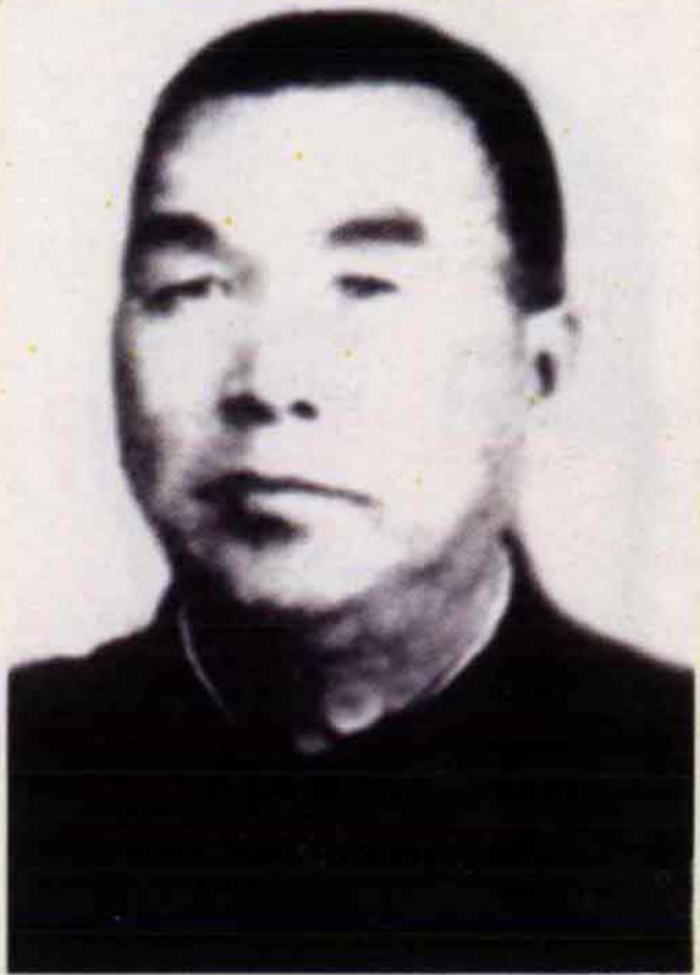
晁哲甫 冀鲁豫边区行政公署主任