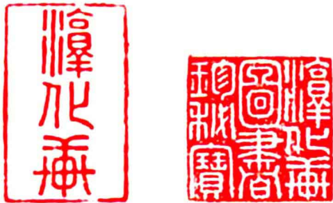
“淳化轩”和“淳化轩图书珍秘宝”印印文

需要说明的是,本书中的“Yuanmingyuan”和“Summer Palace”指的都是圆明园,但这个圆明园不是指我们今天的圆明园遗址公园,而是指整个西郊皇家园林,包含香山静宜园、玉泉山静明园、万寿山清漪园(后重修并改名为颐和园)。咸丰十年(1860)西郊诸多皇家园林遭劫掠时,西洋人根本不清楚各个园子的名称,一律统称其为“Yuanmingyuan”(圆