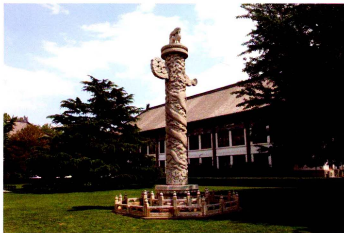
现矗立在北京大学西门办公楼（曾用名施德楼、贝公楼）前的安佑宫华表

安佑宫的四根华表，1925年燕京大学在建校舍（现为北京大学校舍）时，由美国牧师翟伯盗运去三根（其中两根矗于该校主楼前）；另一根则被京师警察厅运往城里，1931年春曾横卧在天安门前之路南。同年夏季国立北平图书馆（今国家图书馆分馆）在北海西岸建成新馆时，即将燕京大学（今北京大学）多余的一根华表，及放于天安门前的一根，皆运去矗在主楼前。