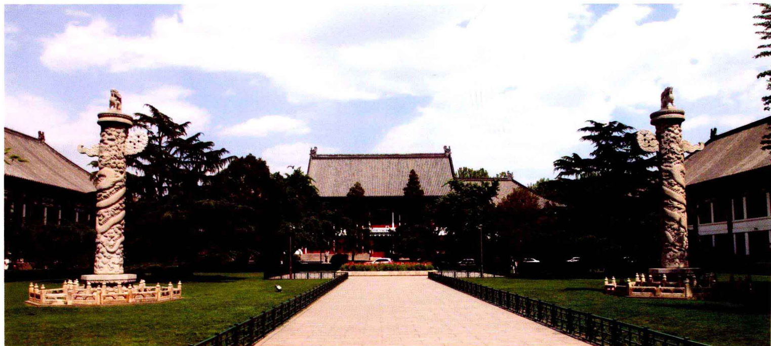
现矗立在北京大学西门办公楼（曾用名施德楼、贝公楼）前的一对安佑宫华表