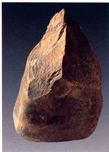
图 1-01 尖状石器

出土石核、石片、石球、石锤、石砧、砍斫器、刮削器、大尖状器等种类的石器 200 余件。砍斫器又有石片砍斫器和砾石砍斫器之分，砾石砍斫器一般是以整块砾石单面打击而成，形成的刃口包括平刃、圆弧刃和尖突刃等；石片砍斫器则有经过二次加工而成者，是在第一步打击的基础上，由破裂面向背面打击而成的。