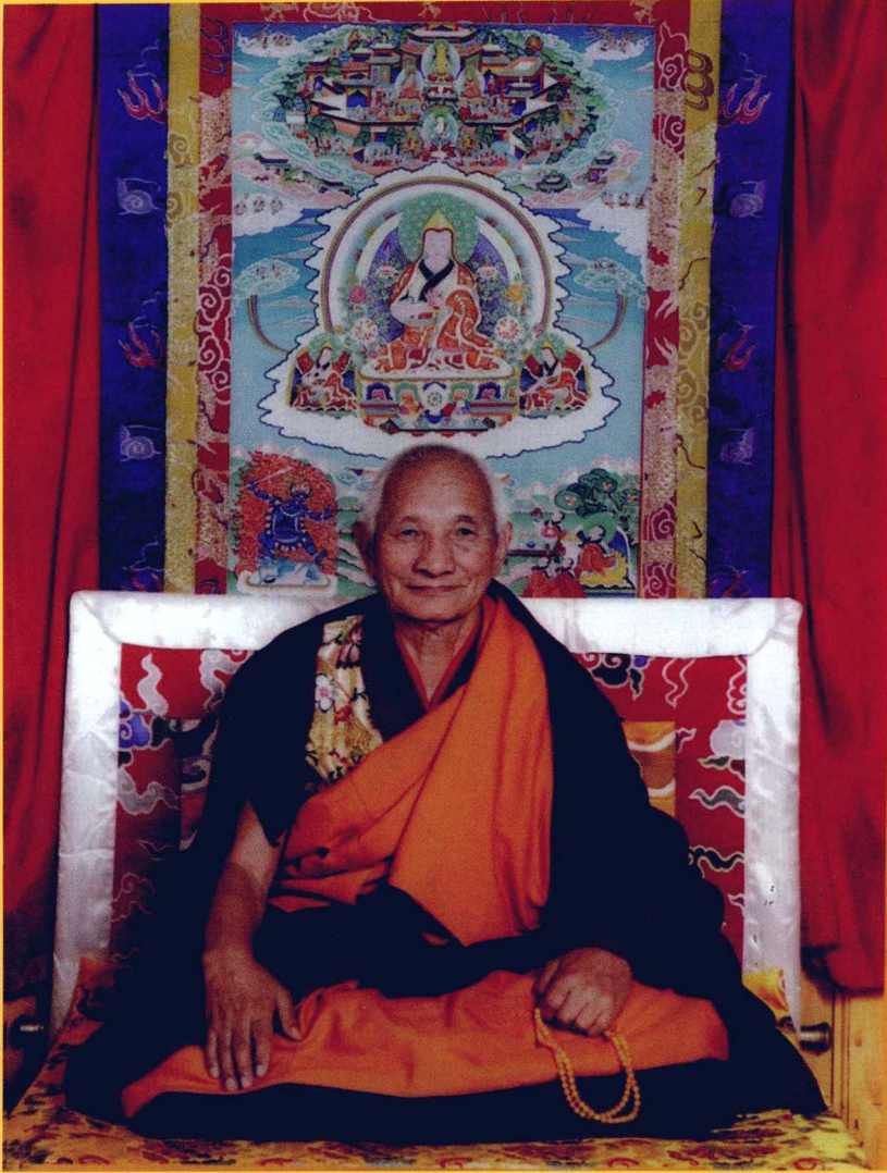
本书释者·十一世班禅之经师江洋嘉措大格西（也译作加羊嘉措、嘉样嘉措）