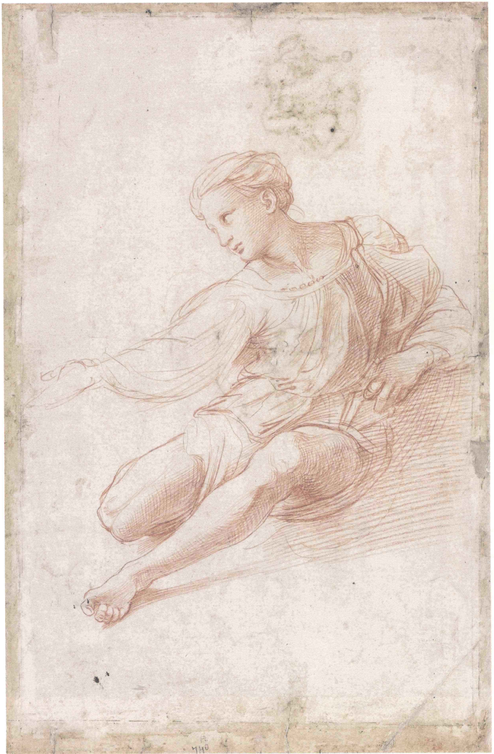
东方 IC 供图