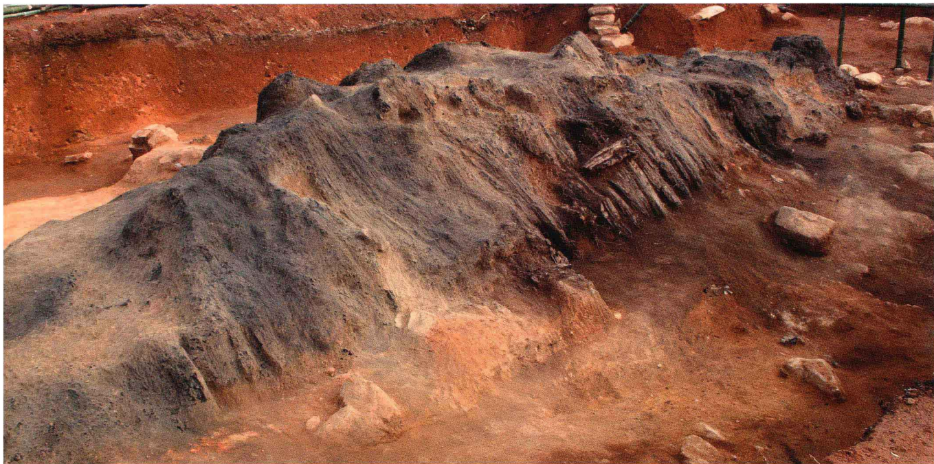
D30M1墓室南部西侧情况(西北—东南)