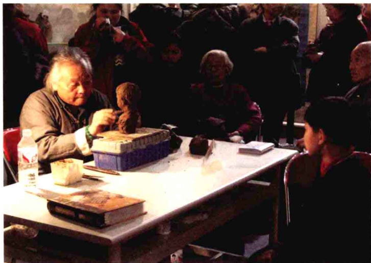
天津“泥人张”工作室透形展示泥塑技艺