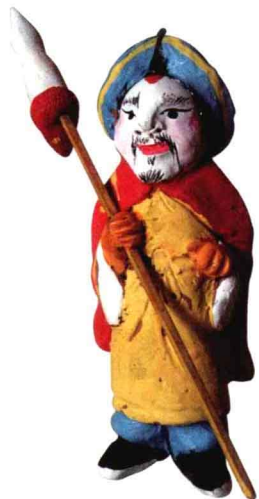
水浒人物 河南浚县