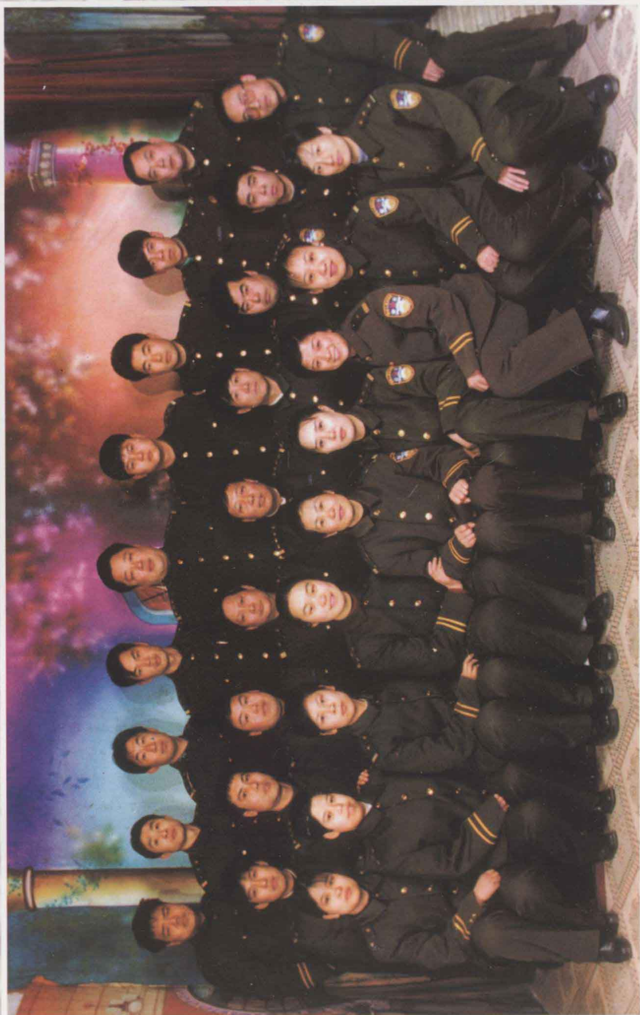
三官庙派出所全体干警