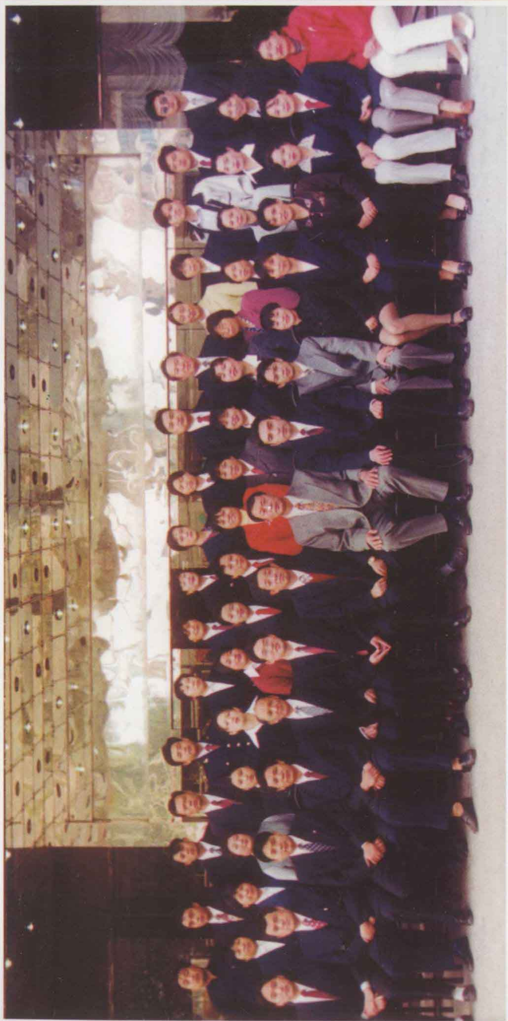
办事处全体工作人员