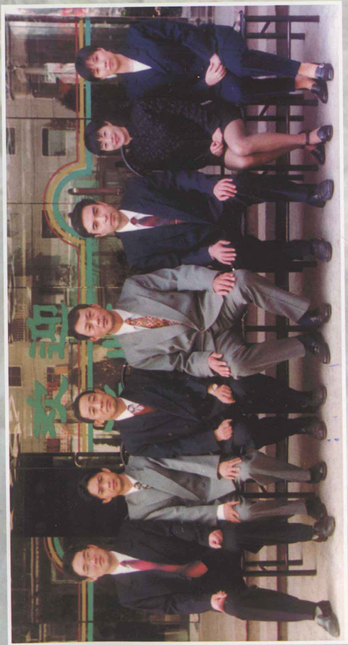
办事处党政领导人