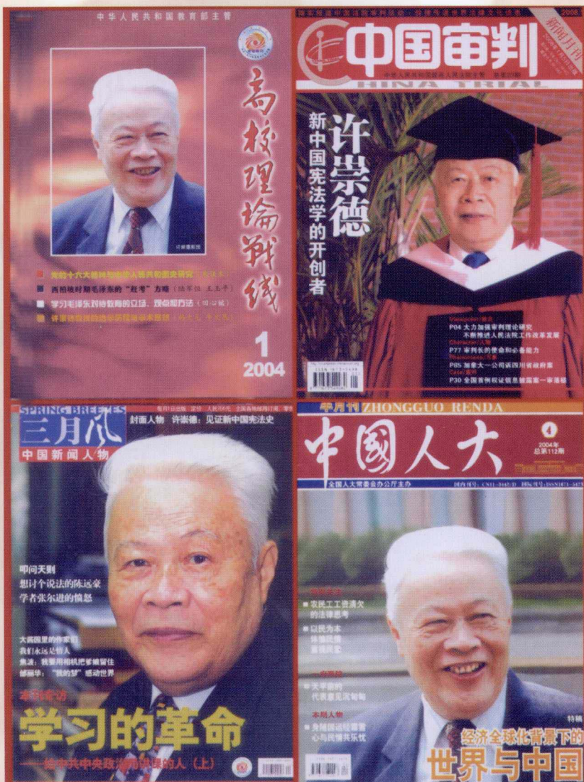
许崇德各类杂志封面照